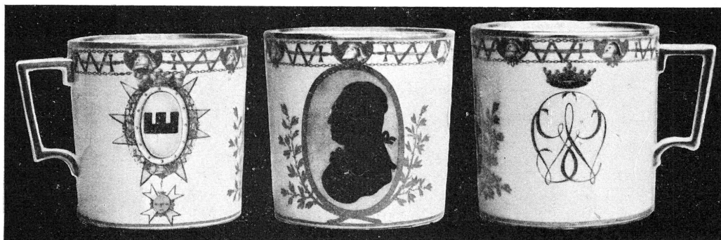
FIG. 1. — Porcelaine de Nyon. (Musée d'Art et d'Histoire.)

Cet objet étant resté en Suisse, il y a lieu d'admettre que le personnage représenté y a fait un séjour ou qu'il y ait eu des amis. Cette supposition s'avère exacte, car un comte Reventlow, grand chambellan du roi de Danemark et ministre d'Etat à Copenhague, ami de Salomon de Sévery, fit des séjours à Lausanne à la fin du XVIII e siècle 2 .