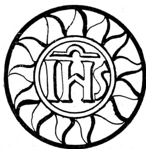
FIG. 106. Linteau de porte, Laconnex, canton de Genève, 1558.