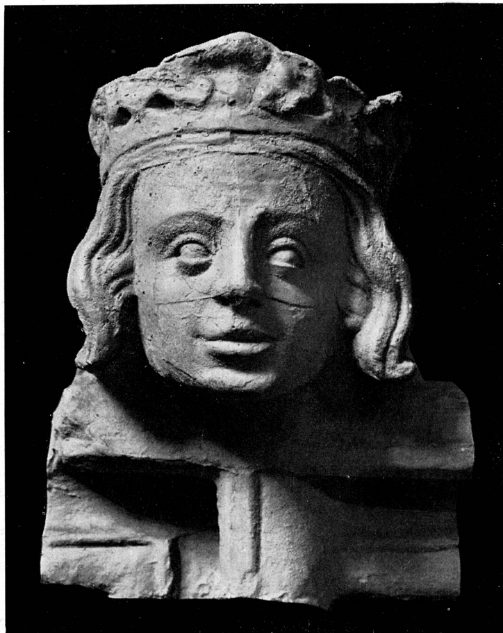
FIG. 130. — Tête, façade de la maison Tavel, XIV e siècle.

sculptées du cardinal de Brogny 1 . Ces sculptures ont inspiré au peuple la légende des humbles origines du fondateur 2 ; très endommagés, les originaux ont été déposés au Musée d'Art et d'Histoire et remplacés par des copies. Quel en était l'auteur ?