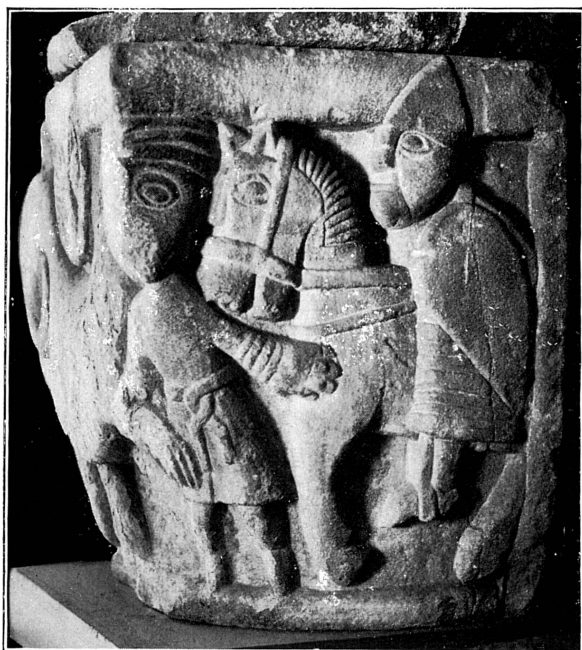
FIG. 124. — Chapiteau de Saint-Pierre, XII e siècle. Musée de Genève.

de ceux qui ornent souvent les plaques de ceinturons de l'époque barbare, mais les détails de l'armure se retrouvent sur la tapisserie de Bayeux, à la fin du