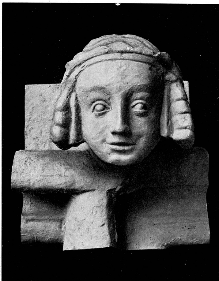
FIG. 127. — Tête, façade de la maison Tavel, XIV e siècle.

A l'intérieur de la chapelle des Macchabées , terminée en 1405, des culs-de-lampe représentaient saint Jean l'Évangéliste et saint Jean-Baptiste 1 ; à l'extérieur, c'étaient les bustes de Dieu le Père et de Dieu le Fils ( fig. 131-2 ) 2 ; sous la console