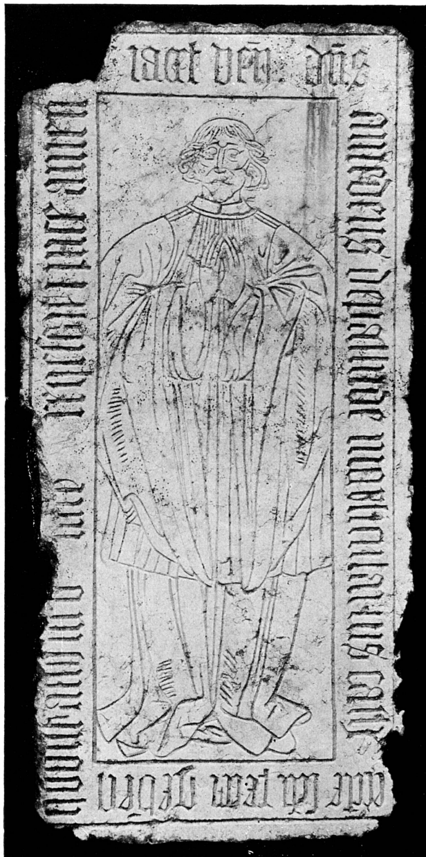
Fig. 140. — Dalle funéraire du marguillier Amédée de la Palud, mort en 1530. Musée de Genève.