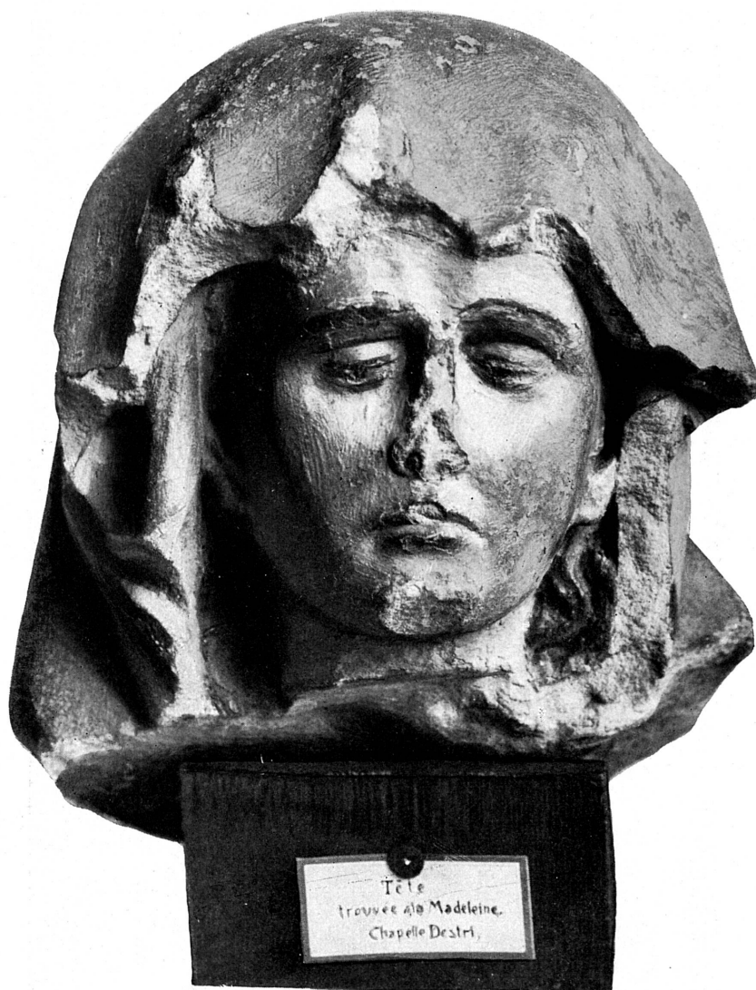
FIG. 138. — La Madeleine, tête d'une Vierge de Pitié, XV e siècle. Musée de Genève.

vents, et qui ont été sauvagement détruites lors de la Réforme, n'ont laissé que de rares fragments 1 . L'un d'eux, de bon style du XV e siècle, et d'une polychromie bien