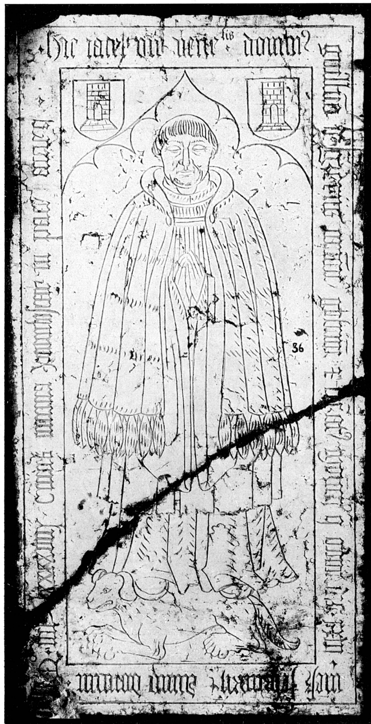
FIG. 139. — Dalle funéraire du chanoine Guillaume de Greyres, mort en 1498. Musée de Genève.