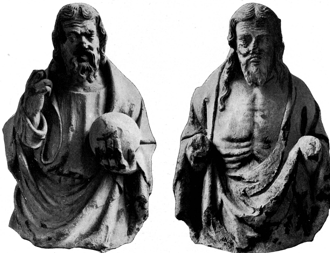
Fig. 131-2. — Saint-Pierre, chapelle des Macchabées, début du XV e siècle. Musée de Genève.

La décoration sculptée des autres églises offre moins d'intérêt. Elle ne comporte guère que des culs-de-lampe et des clefs de voûte, le plus souvent avec écussons aux armes des donateurs et des fondateurs, surtout ceux des chapelles, et parfois effacées ou non identifiées. Elle date des dernières transformations des édifices avant la Réforme et s'espace sur le XV e et le début du XVI e siècles.