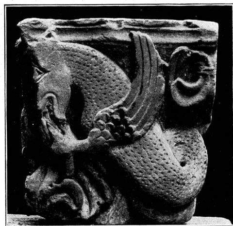
FIG. 125. — Chapiteau de Saint-Pierre, XII-XIII e siècle. Musée de Genève.