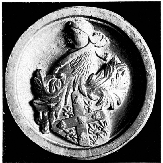
FIG. 137. — Notre-Dame la Neuve, clef de voûte, armoiries du chanoine Jean-Marie, XV e siècle.