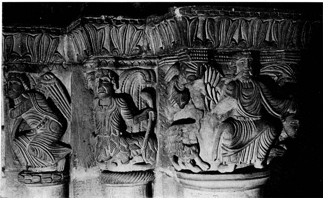
FIG. 128-9. — Chapiteaux de Saint-Pierre, fin du XII siècle.