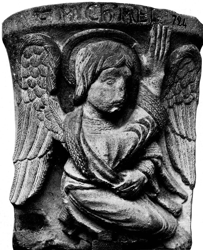
FIG. 126. — L'archange saint Michel, console du XIII e siècle. Musée de Genève.

Les têtes masculines et féminines, les protomés animales, sculptées en ronde bosse sur la façade de la maison Tavel , après sa reconstruction nécessitée par l'in-