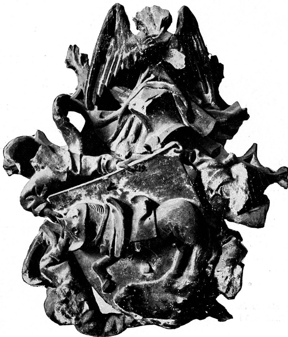
FIG. 135. — La Madeleine, armoiries Destri, XV e siècle. Musée de Genève.

A Notre-Dame-la-Neuve (Auditoire), les armes répétées sur des clefs de voûte