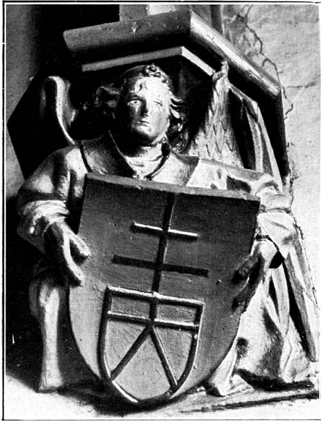
FIG. 136. — Notre-Dame la Neuve, cul-de-lampe, armoiries indéterminées, XV e siècle.

Chabert, mort en 1215, que l'on considérait comme le fondateur de l'église. Seraient-ce plutôt celles d'un marchand, Clément Pontex, qui aurait fait élever le