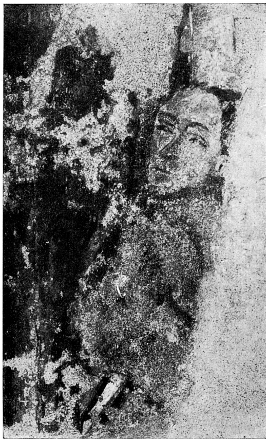
FIG. 159. — Fresque de la chapelle des Macchabées, XV e siècle. Musée de Genève.

avait été exécutée en 1401 par Jacob Jacquerin de Turin 1 ; à l'oratoire de Jean Nergaz, une autre Notre-Dame de Pitié 2 ; à Notre-Dame-des-Grâces des Augustins, une Vierge célèbre qui ressuscitait les enfants morts-nés pour permettre de leur conférer