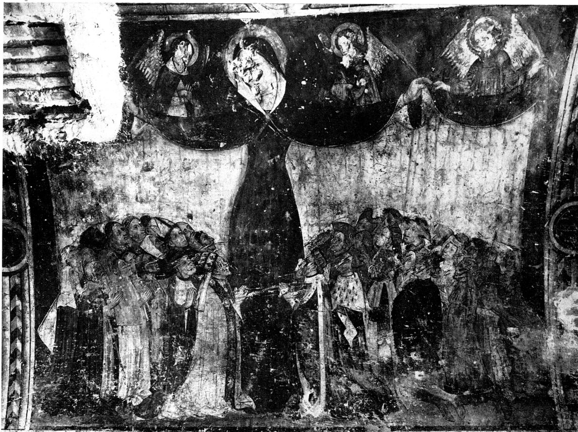
FIG. 161. — Fresque de Saint-Gervais: la Vierge de Miséricorde, XV e siècle.