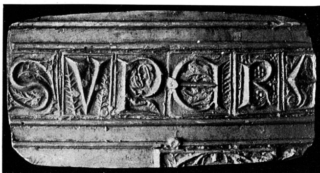
FIG. 164. — Détail de la cloche « Colette », Saint-Pierre, 1472.