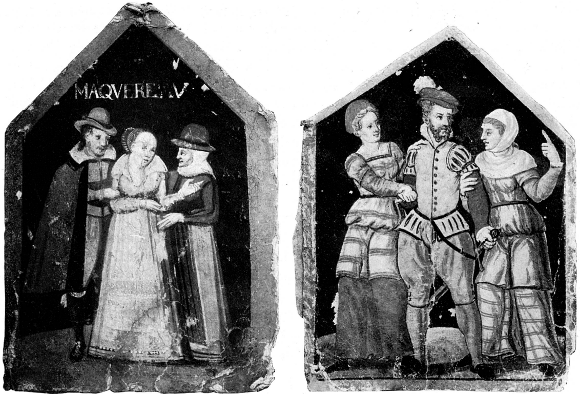
FIG. 162-3. — Mitres en carton peint, début du XVI e siècle. Musée de Genève.

Comme les sculpteurs, les peintres ne dédaignent pas des travaux plus humbles. Ils exécutent des dais 1 , des panonceaux armoriés 2 , pour les fêtes et les ensevelissements, revêtent de leurs figures et couleurs les édifices en bois et en toile, les