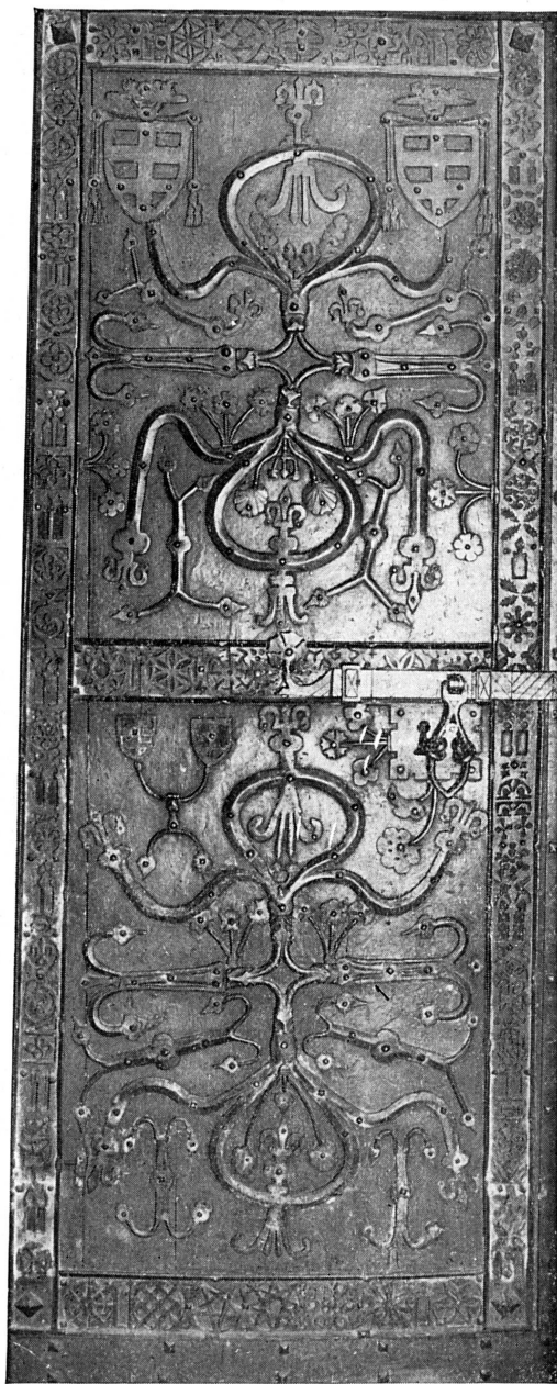
FIG. 171. — Porte de la chapelle des Macchabées, XV e siècle.

Les ferblantiers contribuent à la décoration de la ville, lors des fêtes et des solennités, en agençant des pièces en tôle; à l'entrée de la duchesse de Savoie, en 1501, on voit une marguerite en tôle, qui s'ouvre 1 , et «une fontaine de Justice gardée de trois jeunes filles représentans aulcunes villes»... «Humbert, fils de Michiel Vasal, peintre de Belley, a apporté une fontaine en thola en ceste ville 2 .» La Justice et les villes étaient sans doute des images de métal qui surmontaient la fontaine. En 1523, à l'occasion de l'entrée d'Isabelle de Portugal à Genève, on conçoit un divertissement pareil: «devant la maison de ville sera Genesve ayant à l'entour Bon vouloir et Libéralité, qui donnent à boire du vin de la fontaine à tous venants» 3 . S'agit-il ici encore de figurines métalliques? On peut imaginer ces machines sur le modèle de la fontaine en tôle faite pour les fêtes de l'Alliance en 1584, et conservée au Musée de Genève.