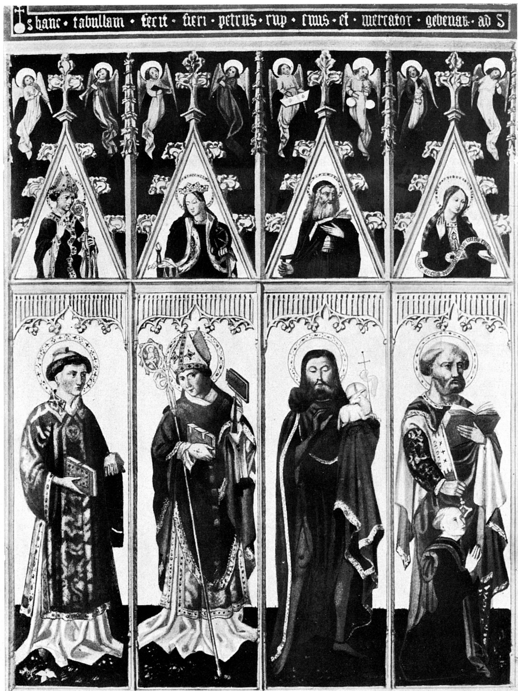
FIG. 173. — Retable de Pierre Rup, XV e siècle. Musée de Dijon.