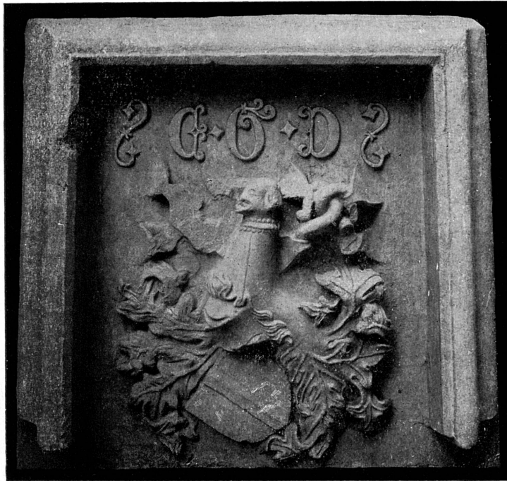
FIG. 172. — Armoiries Bolomier, 1443. Musée de Genève.