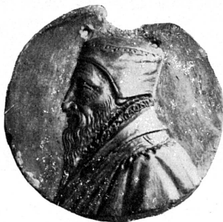
FIG. 210. — Th. de Bèze, terre cuite, Bibliothèque publique et universitaire.