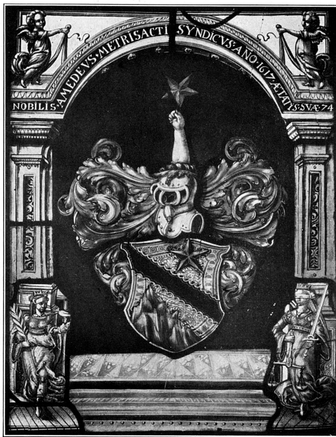
FIG. 247. — Vitrail aux armes Mestrezat, 1617. Musée de Genève.

Vautron, Jean (1588-1671). Autre fils de Nicolas, sans doute simple maître vitrier. — SKL , s. v.