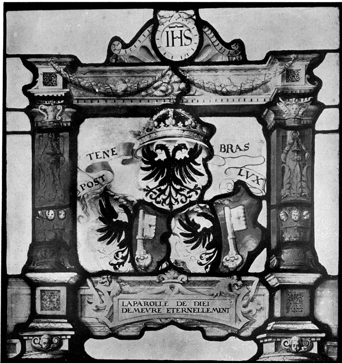
Fig. 246. — Vitrail aux armes de Genève, 1547. Musée de Genève.

qu'il « n'a pas gagnyé aut tâche des verrières qu'il a faict aut temple de la Magdeleine »); BHG , V. 1925, 65 (ms. Dufour); MARTIN, La Maison de Ville de Genève , 43. et note 6; 63