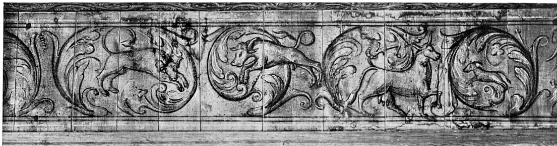
FIG. 249. — Détail du plafond de la maison Necker, Satigny. Début du XVII e siècle.

Des plafonds peints en grisaille ou en couleurs vives entre les poutres apparentes agrémentent les demeures des XVI e et XVII e siècles de leurs rinceaux, où se jouent parfois des personnages et des animaux, quadrupèdes, oiseaux. Les maisons de Brandis au Molard 4 , rue Calvin 3 5 , Necker à Satigny 6 (fig. 249-50), la comman-