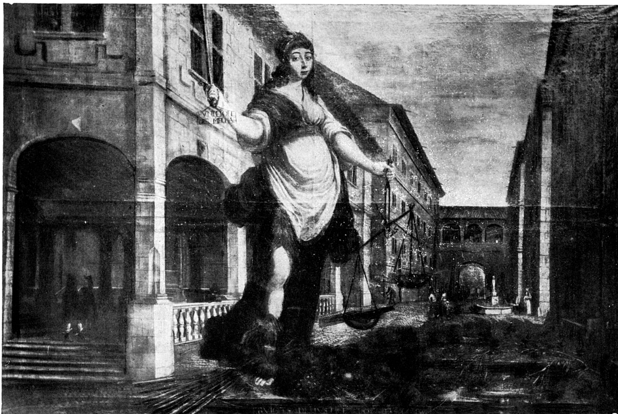
FIG. 251. — Tableau allégorique de « la Justice », par Samuel de Rameru, 1652. Musée de Genève.

peinture du début du XVII e siècle représente la cité de Genève et la tentative de l'Escalade de 1602 1 . On voit au Musée d'Art et d'Histoire un tableau allégorique dit « de la Justice » ( fig. 251 ). Au premier plan, la Justice tient l'épée et la balance. Bien que cette figure soit banale à cette époque, des légendes précisent son rôle, pour ceux qui pourraient le méconnaître : « Punition des méchants » ; sur le centre de gravité de la balance : « Lois » ; sur le plateau qui supporte le poids le plus lourd : « Équité » ; sur le plateau léger : « Iniquité ». Au pied de la Justice, sur une sorte de piédestal, une