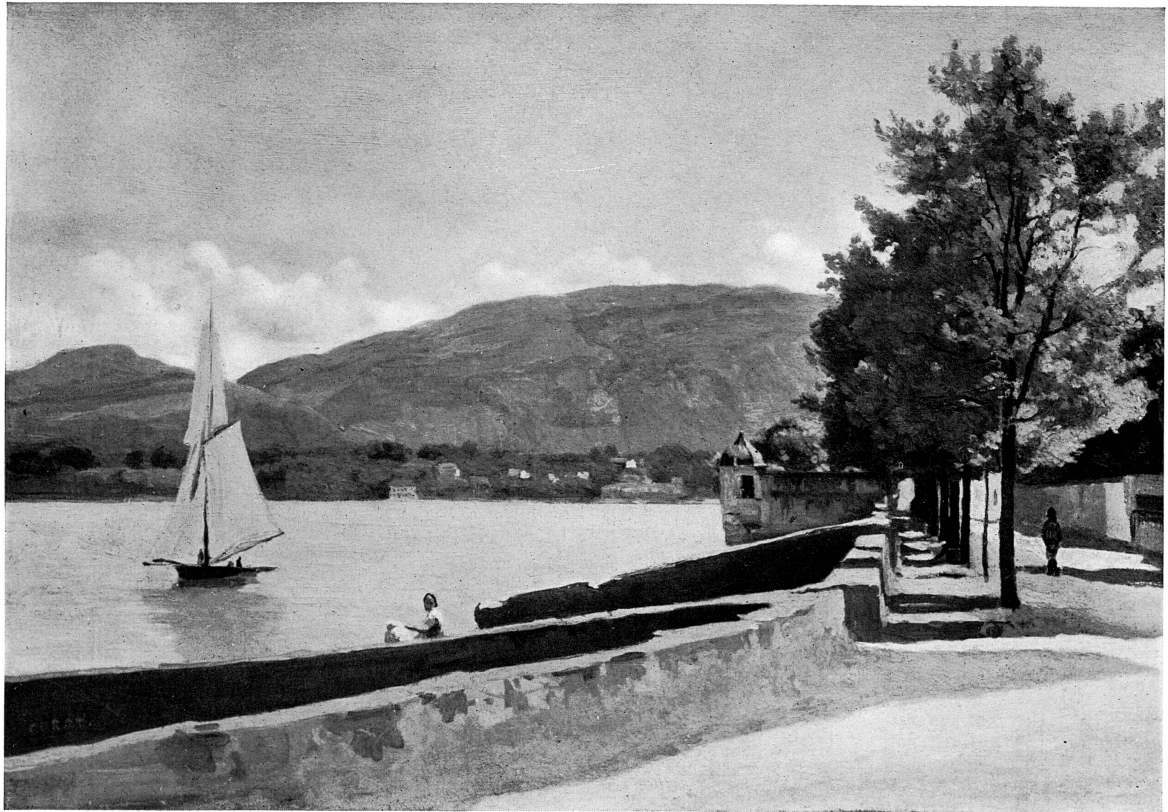
FIG. 273. — Genève, le quai des Pâquis, par C. J. B. Corot (1796-1875). Musée de Genève.