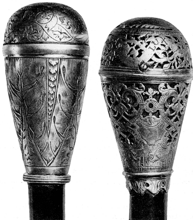
FIG. 294-5. — Bâtons du sautier. Musée de Genève.

De cette industrie locale, notre Musée ne possède que quelques pièces du XVIII e et du commencement du XIX e siècle, bijoux, argenterie usuelle avec poinçons d'orfèvres genevois 6 .