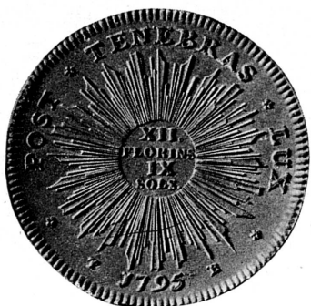
FIG. 296. — Ecu de 1795. Musée de Genève.