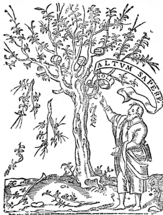
FIG. 327. Marque des Estienne.

CETTE enquête nous a amenés jusqu'à la fin du XVIII e siècle; encore en avons-nous négligé les dernières années et omis en général les noms des artistes et des artisans qui, nés à ce moment, appartiennent par leur activité au XIX e siècle. La Révolution, puis l'annexion à la France rompent avec le passé local et préparent le XIX e siècle. La Restauration genevoise de 1814 pourra en apparence renouer la tradition, elle n'empêchera pas l'esprit nouveau de se manifester dans toutes les formes sociales, dans celles des arts et des industries. Certaines activités, jadis florissantes, déclinent et même disparaissent, d'autres surgissent ou se développent. Une période est close, une autre va s'ouvrir.