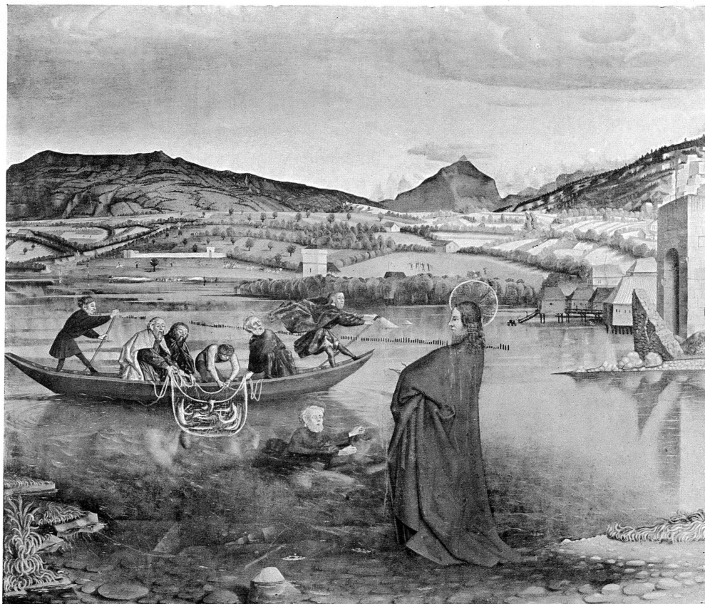
Pl. XI. — Conrad Witz. La pêche miraculeuse. 1444. — Musée de Genève, N° 1843-11