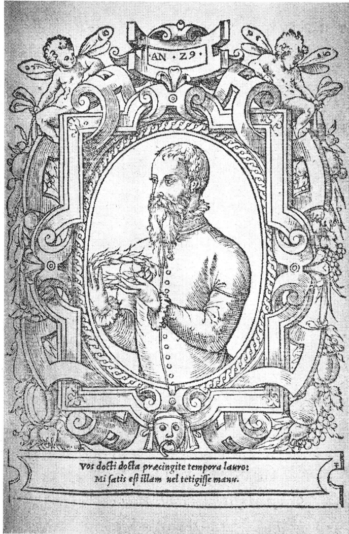
Fig. 18. — Frontispice des Poemata de Th. de Bèze (1548)

Voilà, à notre connaissance, les très rares données qui peuvent constituer, ou tenter d'enrichir, l'histoire de cette image du jeune patricien bourguignon. A ce propos, nous avons déjà signalé le portrait 10 de l'édition de 1548 des Poemata ; nous