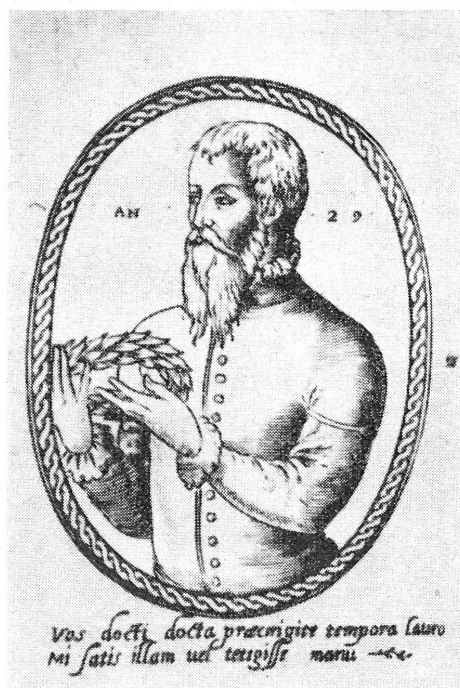
Fig. 19. — Portrait ajouté à certains exemplaires des Poemata [cf. note 10]