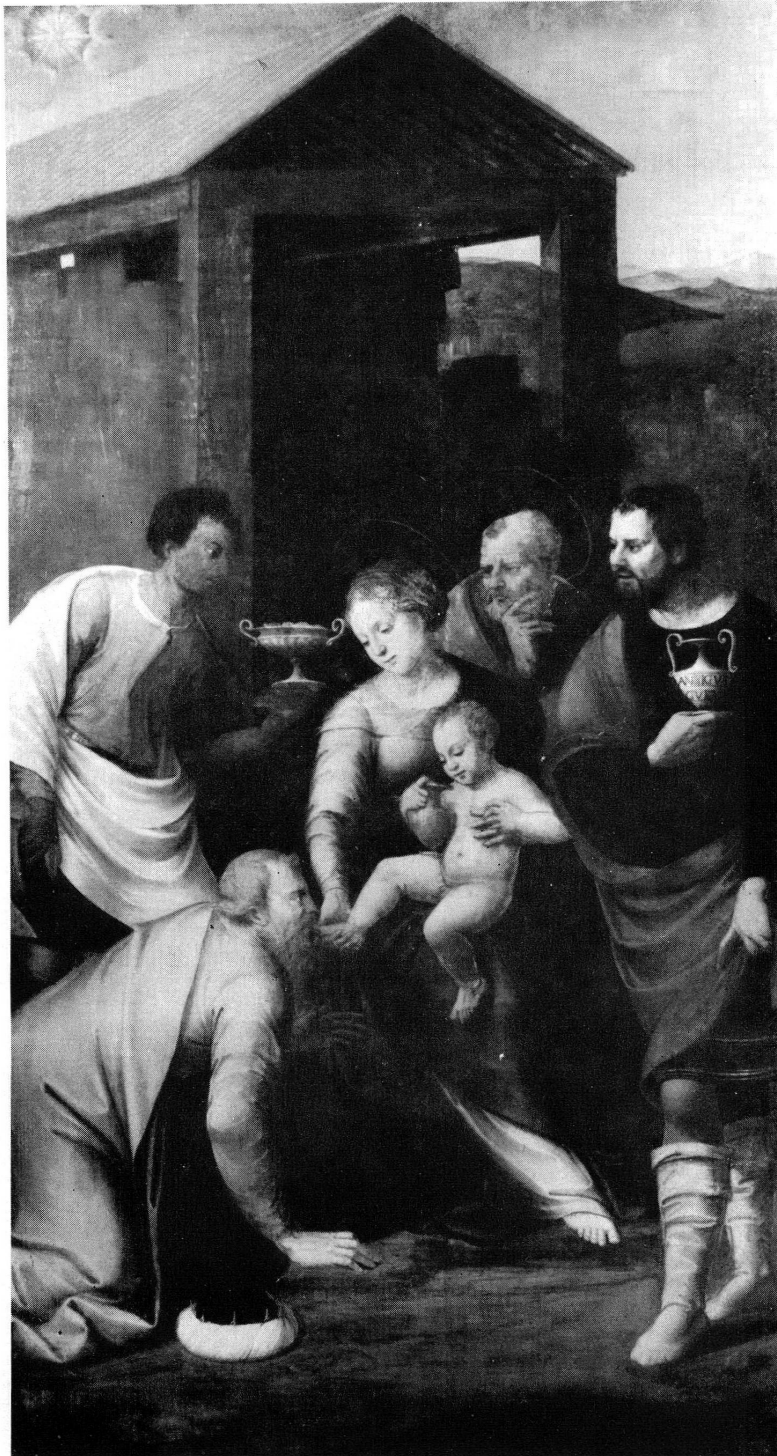
Fig. 5. Henri Guigo dit Guignonis. L'Adoration des Mages. (Huile sur bois.)