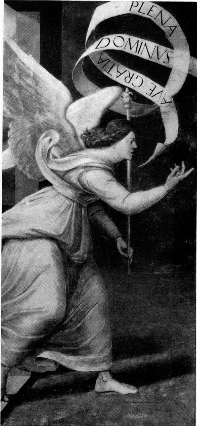
Fig. 1. Henri Guigo dit Guignonis. L'Ange de l'Annonciation. (Huile sur bois.)