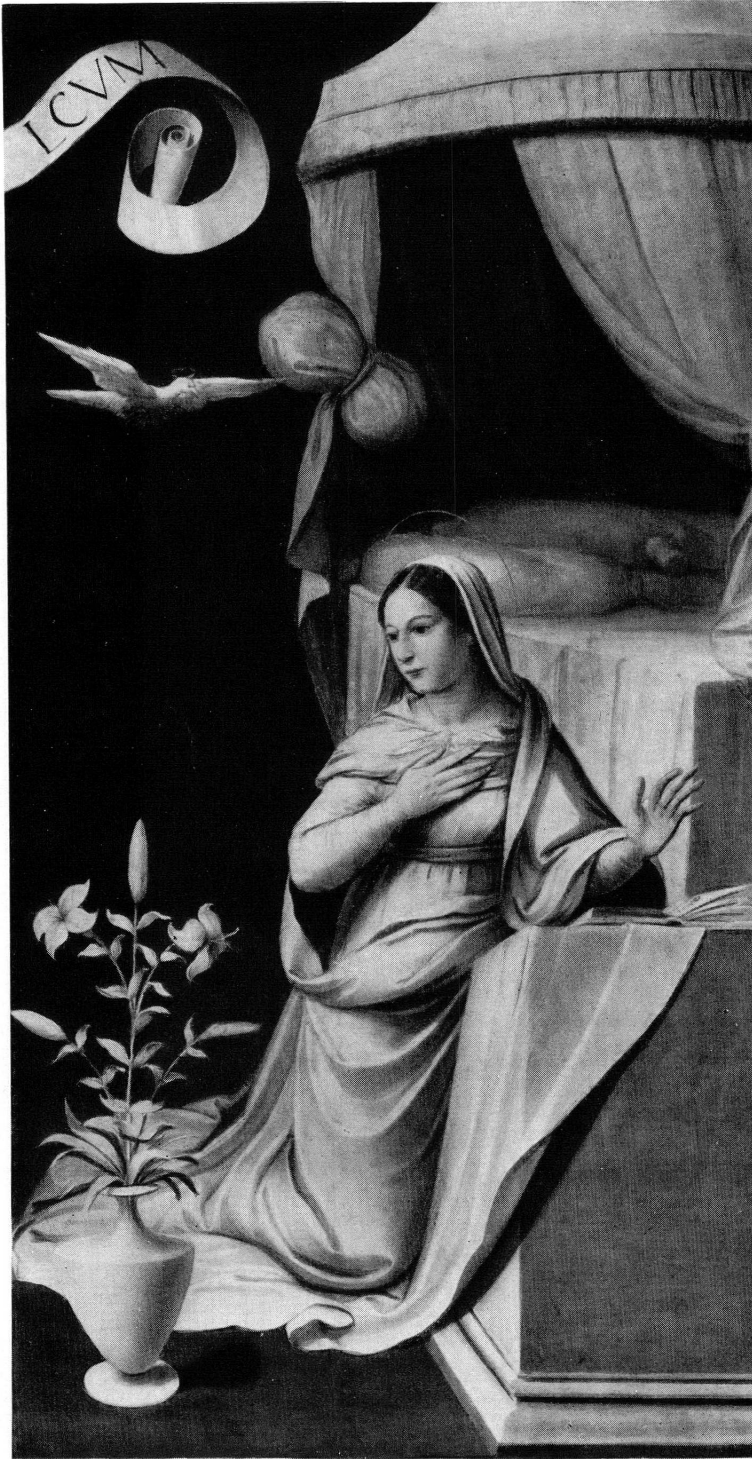
Fig. 2. Henri Guigo dit Guignonis. La Vierge de l'Annonciation. (Huile sur bois.)