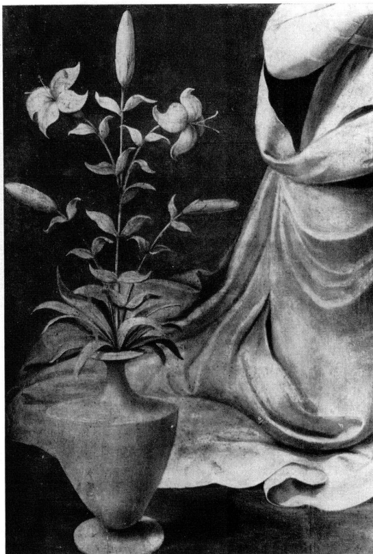
Fig. 3. Henri Guignonis. Détail de l'Annonciation.

collectionneur privé jusqu'à leur entrée au musée. 6 Ces deux volets, s'ils ne présentent pas de caractère artistique très développé, sont intéressants à deux points de vue : pour Genève, puisqu'ils sont attribués à un artiste avignonnais originaire du diocèse de Genève et pour l'histoire de la peinture provençale de la première moitié du XVI e siècle, par ailleurs assez pauvre en documents originaux. Ces deux volets de 165 cm de hauteur et de 87 cm de largeur représentent, à l'extérieur, la Visitation, et, à l'intérieur, l'Adoration des Bergers et l'Adoration des Rois Mages. L'iconographie générale de ce thème si répandu est partiellement influencée par l'Italie du Nord et certains détails prouvent le peu d'invention de la part de l'artiste qui s'est contenté de reproduire, avec plus ou moins d'habileté, des modèles bien connus. Un examen plus attentif de cette œuvre laissait déjà supposer à l'abbé Requin que deux maîtres auraient pu y travailler ; c'est ainsi qu'il notait des diffé-