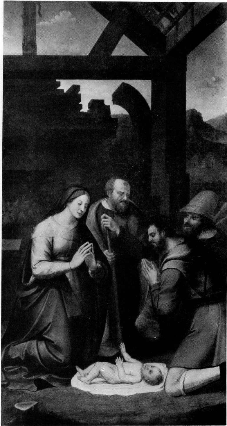
Fig. 4. Henri Guigo dit Guignonis. L'Adoration des Bergers. (Huile sur bois.)