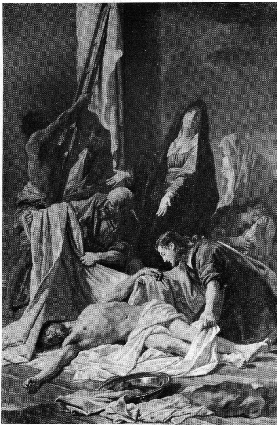
Fig. 3. Jean Jouvenet. Déposition de Croix . Léningrad, Musée de l'Ermitage.