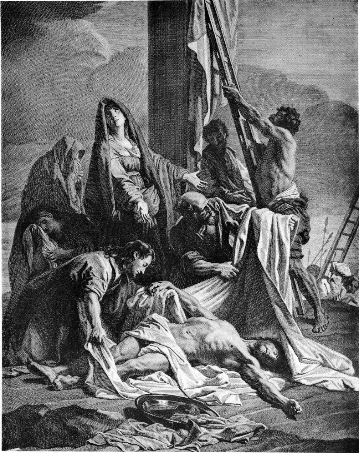
Fig. 6. Jean Jouvenet. Déposition de Croix . Gravure d'Alexandre Loir. Paris, Bibliothèque nationale.