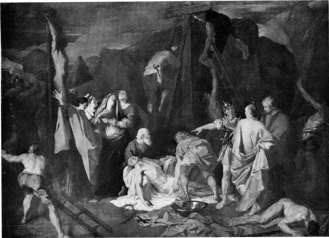
Fig. 4. Jean Jouvenet. Déposition de Croix . Genève, Musée d'art et d'histoire.

du fameux cardinal Faesch, avec qui la famille Faesch-Revilliod était apparentée ? 33 Sinon comment expliquer la présence, dans une ancienne famille genevoise et protestante, d'un tableau religieux aussi fortement marqué par l'art de la Contre-Réforme ?