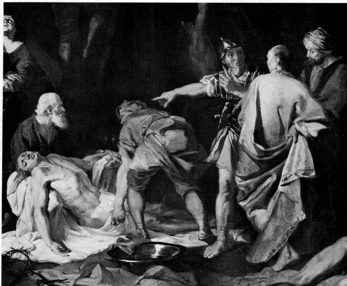
Fig. 7. Jean Jouvenet. Déposition de Croix . Fragment. Genève, Musée d'art et d'histoire.

souvent son maître « le disciple n'étant que le secours mécanique et lui l'esprit ». Il avait subi si fortement l'empreinte de Jouvenet que Mariette dira de lui: « Il a fait d'assez belles choses, mais qui ressemblaient trop à celles qu'il avait vu faire à son oncle. Non seulement il était sectateur de sa manière, mais on peut dire qu'il en était presque le copiste... » 39