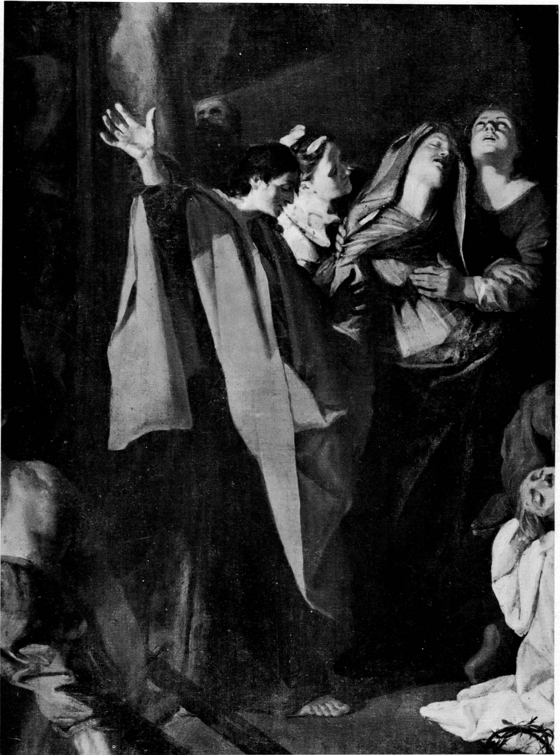
Fig. 8. Jean Jouvenet. Déposition de Croix . Fragment. Genève, Musée d'art et d'histoire.