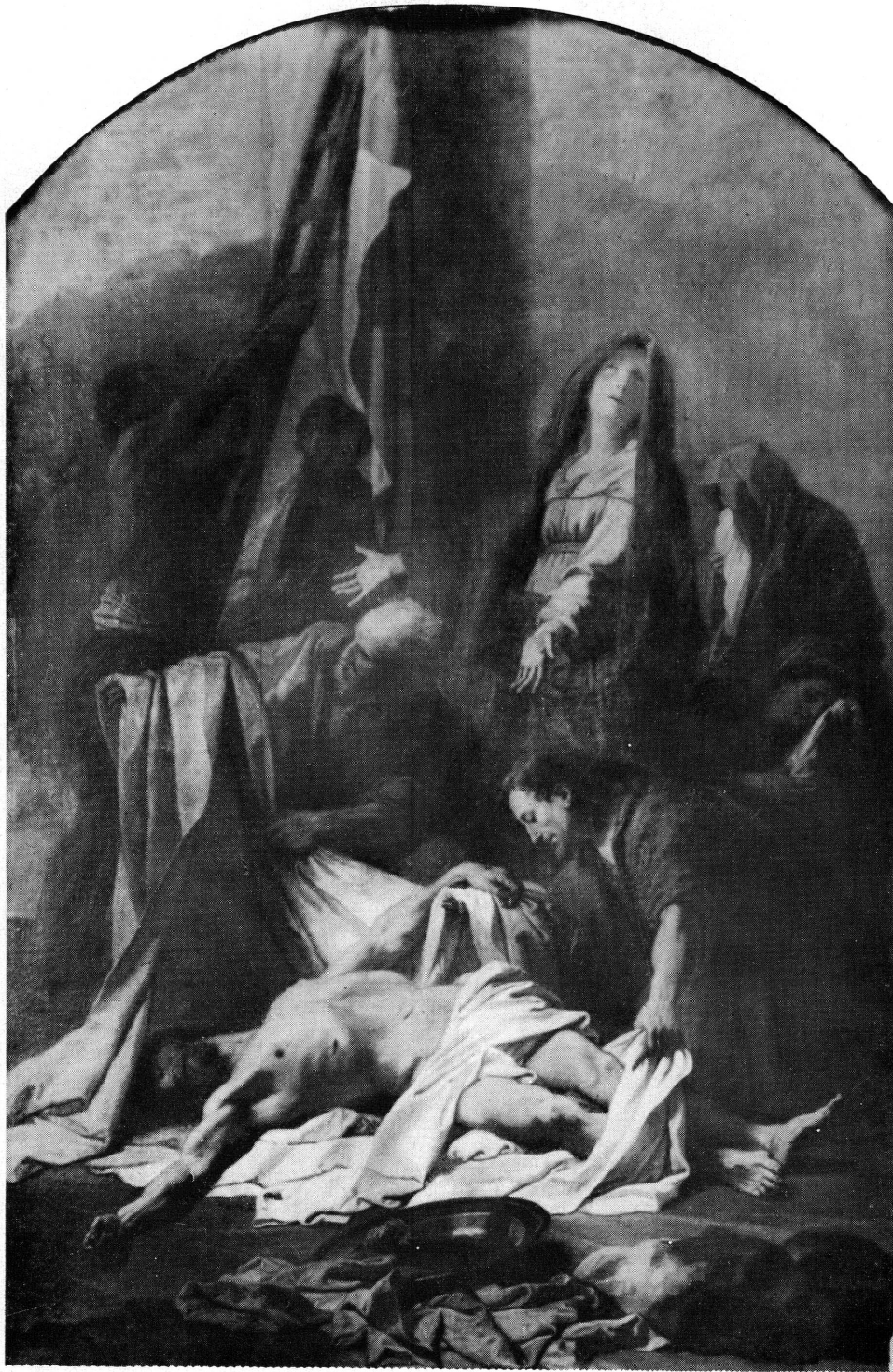
Fig. 1. Jean Jouvenet. Déposition de Croix . Pontoise, église Saint-Maclou.