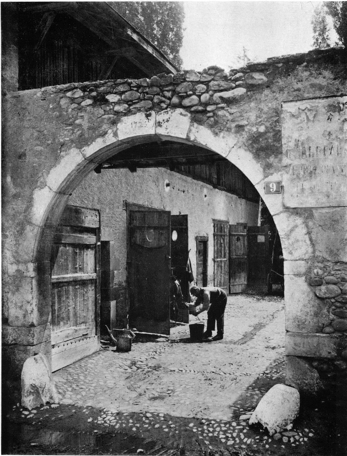
Fig. 1. Carouge. Rue du Cheval blanc, n° 9. Porte datée 1725 (démolie en 1957).