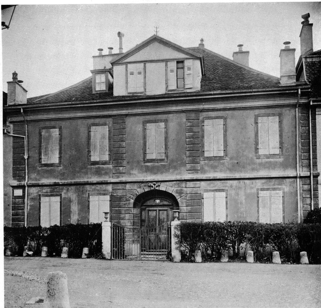
Fig. 3. Le Grand Bureau en 1900.