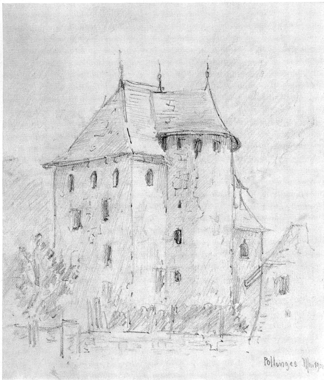
Fig. 4. Château de Polling. Dessin de Louis Blondel.