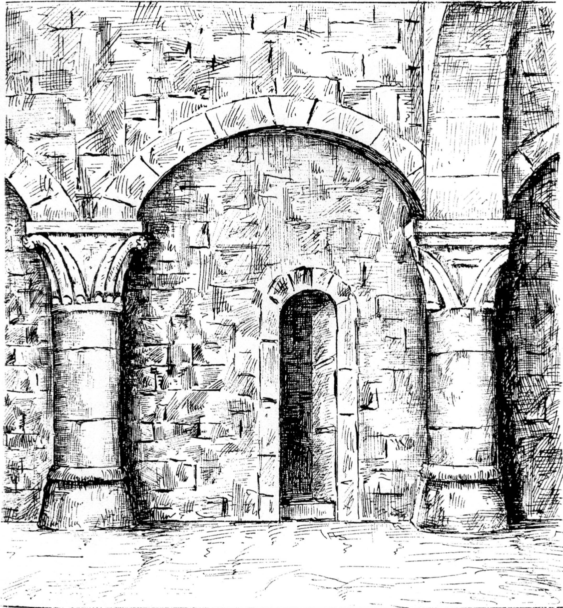
Fig. 2. Cave romane. Maison Tavel. Dessin de Louis Blondel (1901).