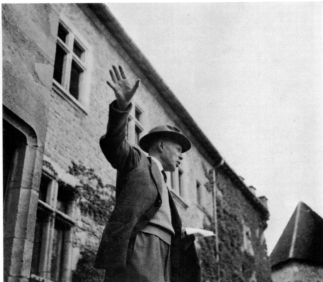
Fig. 1. Excursion de la Société d'histoire et d'archéologie de Genève en Franche-Comté en 1950. Château du Pin, près Lons-le-Saunier

des antiquaires de France, la Société française d'archéologie l'associèrent à leurs travaux en qualité de membre correspondant. Son audience à l'étranger était grande ; en 1921, il collabora au Congrès international d'histoire de l'art et, en 1951, au 3 e Congrès international du haut moyen âge ; en 1952, il fut l'un des participants les plus actifs de la 110 e session du Congrès archéologique de France tenue en Suisse romande.