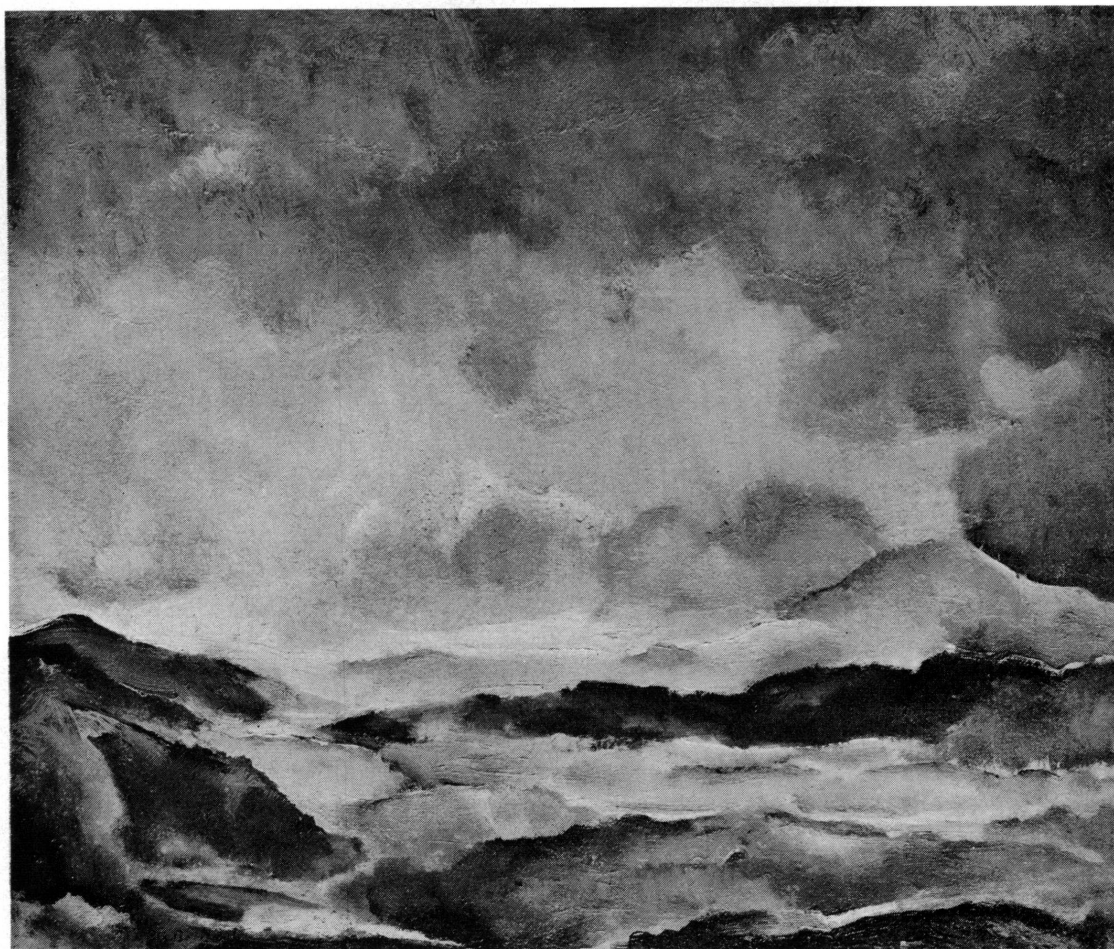
Fig. 1. Rodolphe-Théophile Bosshard, Paysage au ciel mauve , (legs M me René Hentsch).