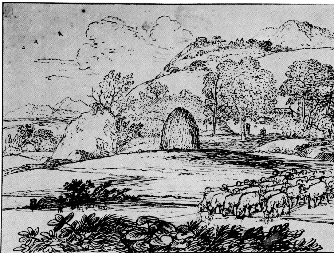
Fig. 2. Claude GELLÉE: Paysage . Collection Wildenstein. Reproduction avec l'autorisation de Wildenstein & Co. Inc.

catalogue de la vente: lot 1388, « a castle, with a running stream in the foreground; trees in the middle distance, and trees on a rising ground; signed, Claudio, 1660, Roma. Pen, washed, 10 in. by 7¼ in. » Il passa pour la somme modeste d'une livre à un marchand, puis apparut à nouveau dans la collection de Barthélemy Menn et de son beau-fils Bodmer, qui le légua, comme œuvre anonyme, au musée en 1912. Comment expliquer que le dessin finit par perdre son ancienne attribution correcte? Il est vrai que la signature « Claudio », mentionnée dans le catalogue de la vente, n'est guère lisible à présent, et le prix atteint à la vente marqua le dessin comme une œuvre peu importante, sinon d'un imitateur. Si certains dessins fameux rapportèrent alors de vingt à cent livres, il est pourtant vrai que la majorité des Claude de Wellesley n'atteignirent que quelques livres. Mais la raison profonde de l'oubli de ce dessin tient à une question de goût: l'ère de l'Impressionnisme découvrit en Claude non plus les paysages classiques composés dans l'atelier, mais un autre aspect de son œuvre tout aussi légitime. Nous entendons par cela le dessin de nature pris sur le vif, d'une inspiration très immédiate, exécuté au moyen de quelques coups brillants