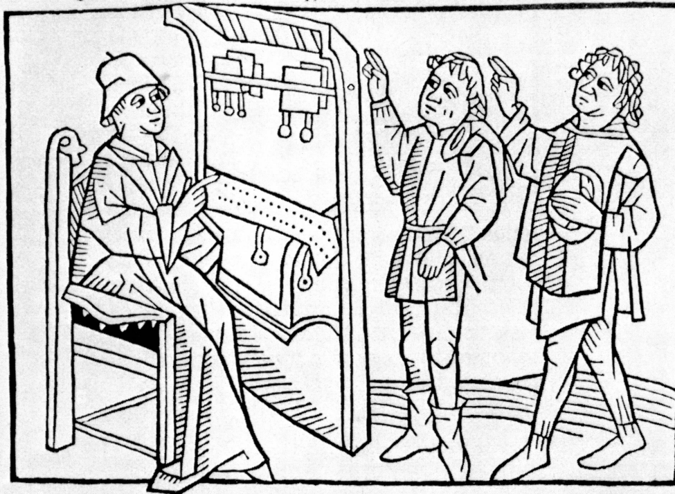
Fig. 5. L'office des notaires et tabellions. Gravure parue dans Le mirouer de la vie humaine , Lyon, 1482, et reproduite d'après Claudin.

Cette famille de châtelains de Châteauneuf semble avoir une certaine prédilection pour la carrière de juriste. Déjà le père est désigné comme « célèbre jurisconsulte », et le dictionnaire mentionne encore un Pierre « dottore in leggi ».