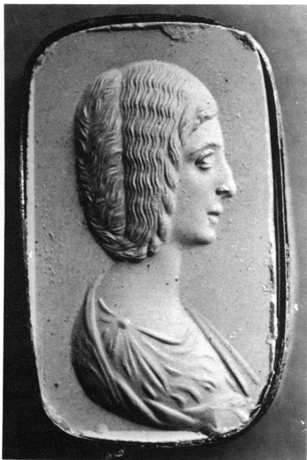
Figure 10. Béryl pâle, h. 24 mm. Metropolitan Museum of Arts. Portrait de Iulia Domna. RICHTER, Catalogue of Engraved Gems, Greek, Etruscan and Roman , Rome, 1956, no. 498; pl. LX et LA MÊME, Engraved Gems of the Romans , Londres, 1971, no. 580; FURTWÄNGLER, Die antiken Gemmen , pl. XLVIII 13. Photographie du moulage agrandie.