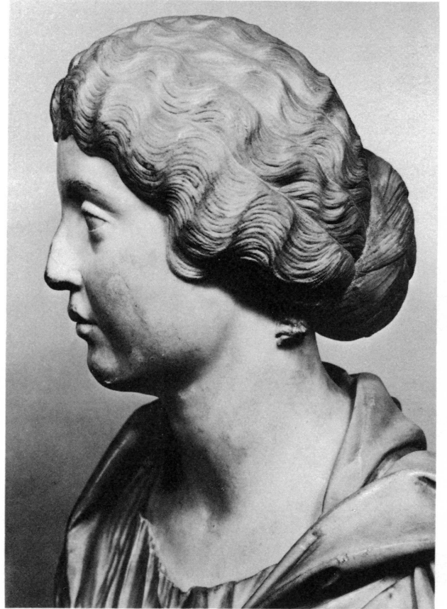
Figure 4. Buste en marbre au Louvre, no. 1144; WEGNER, ibid. , pl. 36, p. 54. Buste de Faustine II, les deux profils (4 et 4 a) photographies du Louvre MA 1144; J. CHARBONNEAUX, La sculpture grecque et romaine au Musée du Louvre , Paris, 1963, pp.168 sq.

morale et éthique, pour faire place à une expression grossière et brutale, fruit de nouvelles vérités.