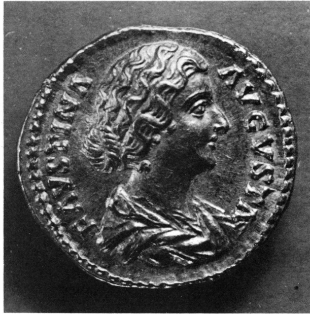
Figure 5. Monnaie en or au British Museum avec le portrait de Faustine II (R. Salus assise, SALUTI AUGUSTAE). Cf. MATTINGLY, British Museum Catalogue, Empire , pl. 56, 3, no. 152. Cf. le même type de monnaie WEGNER, ibid. , pl. 63 m; cf. Roman Imperial Coinage no. 736. Photographie de l'original agrandie.