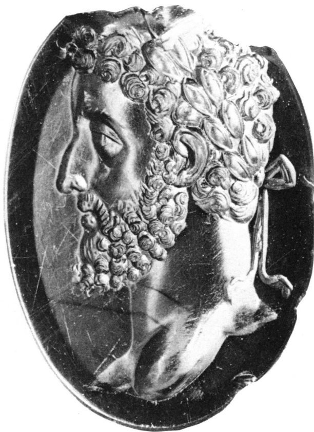
Figure 9. Cornaline cassée en haut, plate des deux côtés; h. 23; l. 16,5; pr. 3 mm. Museo Nazionale, Naples, no. 231. Commode lauré à gauche. Photographie de l'original agrandie.