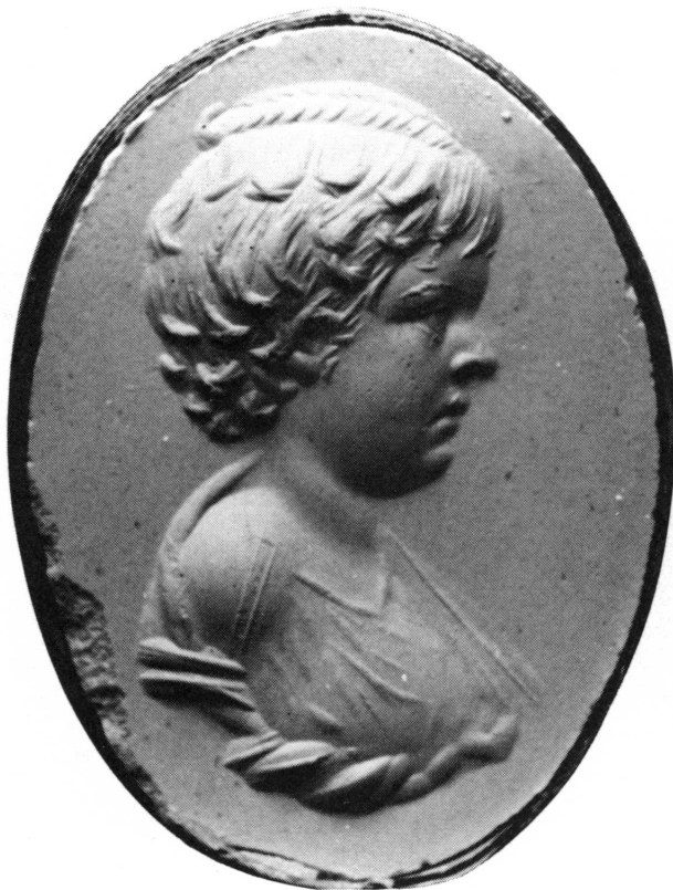
Figure 8. Jaspe rouge, plate des deux côtés; h. 21; l. 16; pr. 3 mm. Museum of Fine Arts, Boston, Don E.P. Warren 01.7565. Buste d'une petite fille vue de profil à gauche (sur le moulage à droite). Photographies de l'original (8) et du moulage (8 a) agrandies.