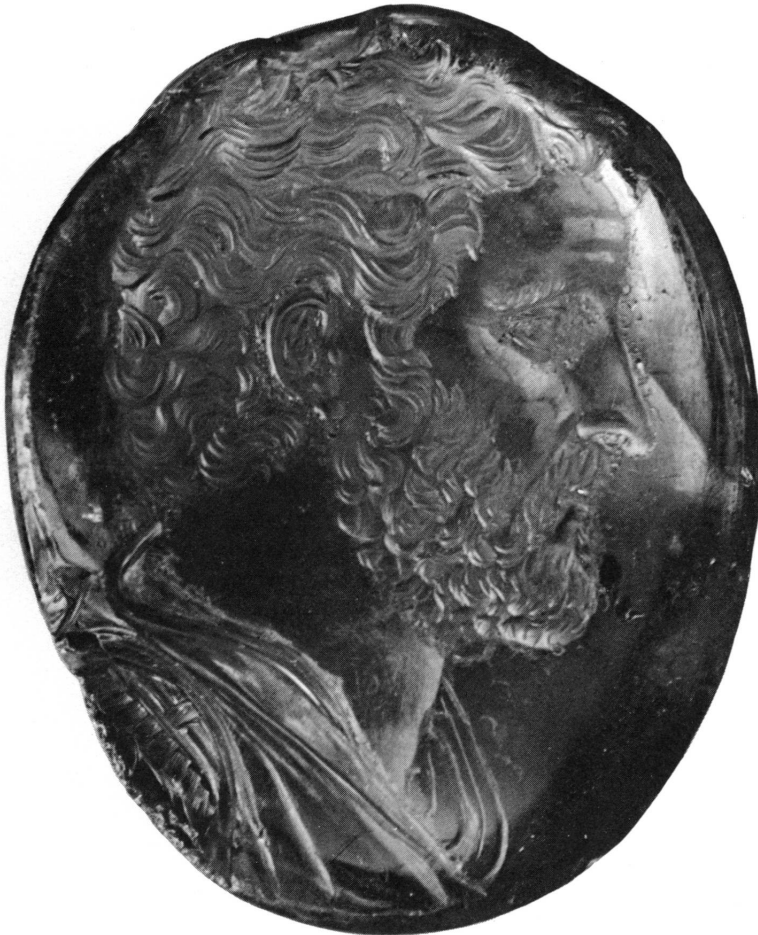
Figure 6. Améthyste à surface bombée et base convexe; h. 29; l. 24; pr. 6 mm. Museo Nazionale, Naples, no. 250. Buste cuirassé d'Antonin le Pieux. Cf. Bulletin de l'Association française de gemmologie , no. 17, décembre 1968, p. 4. Photographie de l'original agrandie.