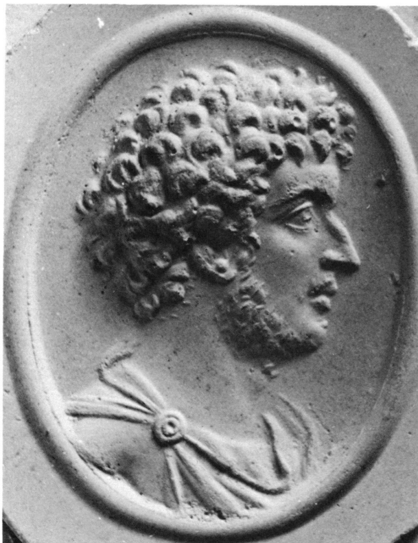
Figure 2. Béryl pâle, verdâtre comme le précédent ; h. 18,5, l. 14,5 mm. Cabinet des Médailles, Bibliothèque nationale, Paris. Don du Duc de Luynes no. 157. Portrait de Lucius Verus vêtu du paludamentum et portant une courte barbe frisée. Il est vu de profil à gauche (sur le moulage à droite). Photographies du moulage (2) et, en bas, de l'original (2 a) agrandies.