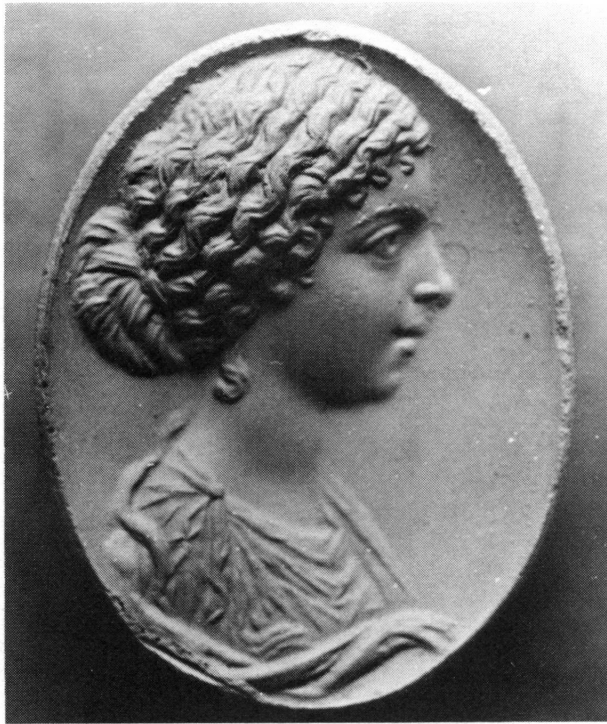
Figure 7. Intaille au British Museum avec le portrait de Lucilla, fille de Faustine II. Améthyste, h. 20; l. 14 mm. WALTERS, Catalogue of the Engraved Gems and Cameos, Greek, Etruscan and Roman, in the British Museum , Londres, 1926, no. 2016; RICHTER, Engraved Gems of the Romans , Londres, 1971, no. 562. Photographie du moulage agrandie.