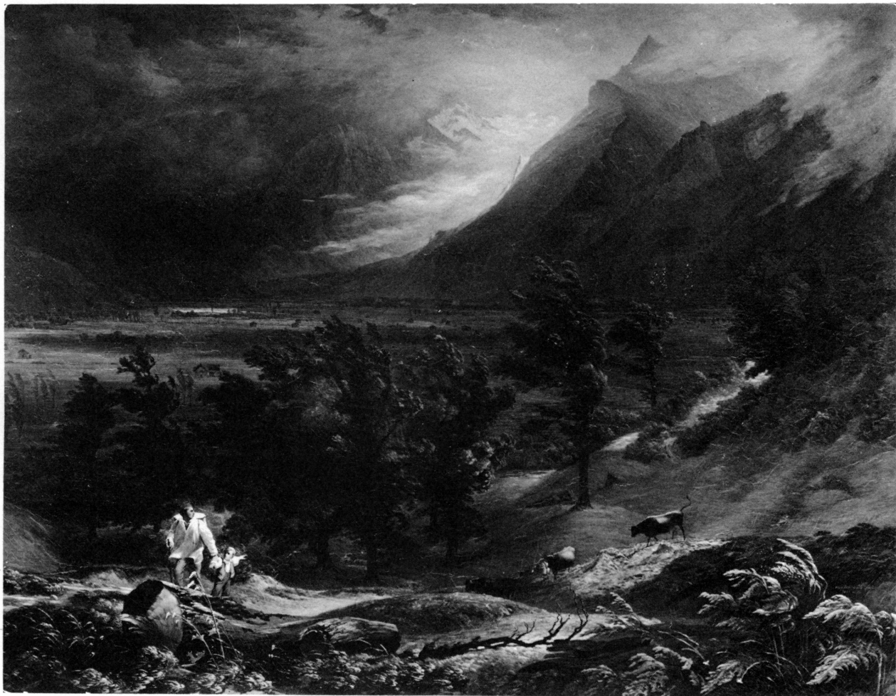
Figure 2. Maximilien de Meuron, La vallée de Naeffels. Orage (1849). Musée d'art et d'histoire, Neuchâtel.

De Meuron brise cet ordre. L'ordre du monde ne lui est plus extérieur mais intérieur. La mon-