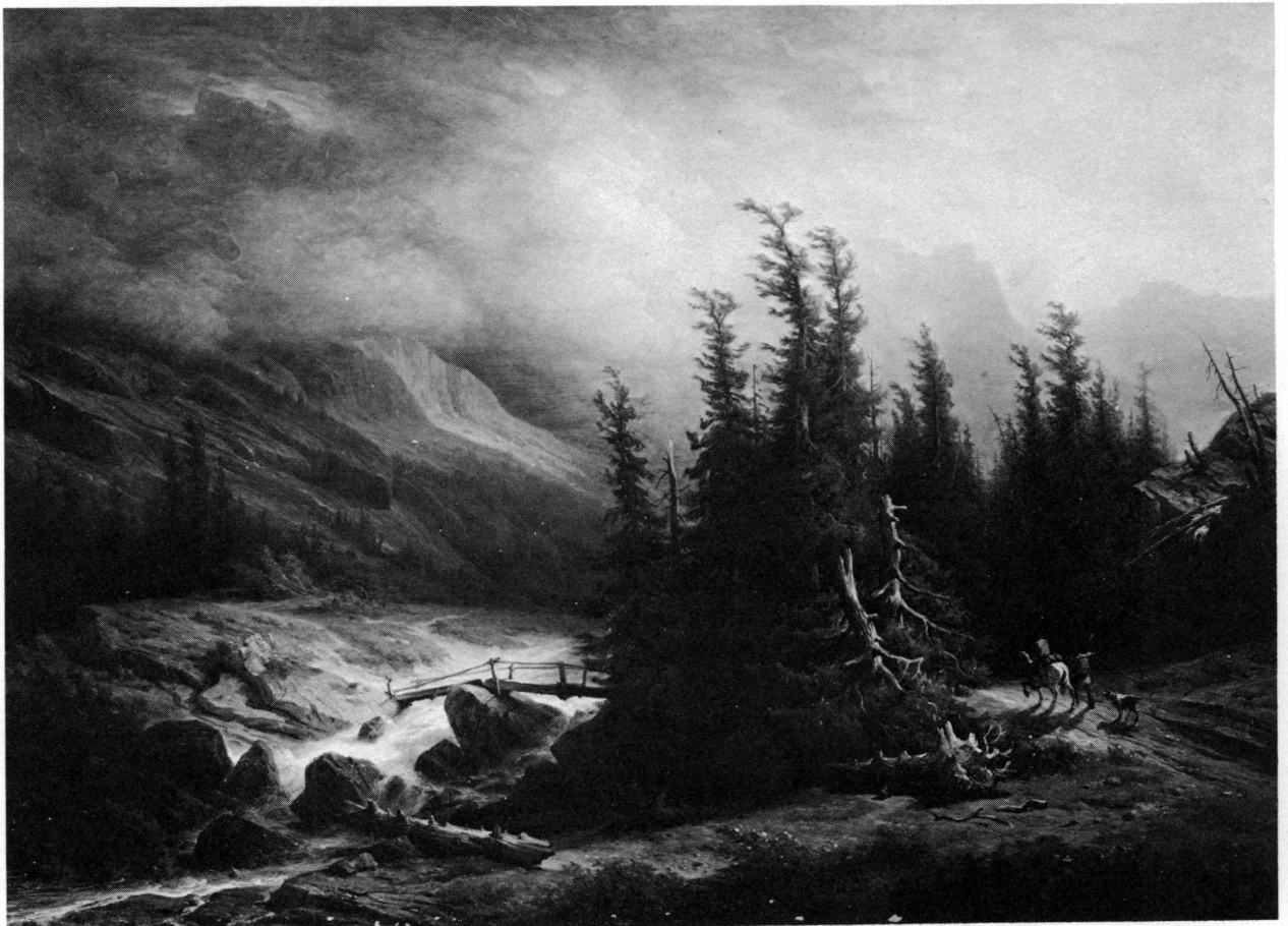
Figure 10. François Diday, Chemin du Grimsel à la Handeck (1873). Musée d'art et d'histoire, Genève.

On notera la profonde différence qui sépare cette pensée helvétique de la pensée française: le grand critique français de l'École davidienne Etienne-Jean Delécluze écrivait à Rodolphe Töpffer: « Dans les parties hautes des Alpes j'ai toujours éprouvé les effets d'une poésie accablante. L'homme est anéanti, il disparaît, il n'existe plus. Or, l'expérience prouve que là où l'homme n'est plus centre, là où il ne sert plus de mètre au moyen duquel on apprécie la grandeur relative (physique ou morale) des choses, il n'y a pas d'art possible. En face de cette Jungfrau dont vous parlez, j'ai admiré sans comprendre; à peine si je l'ai sentie [...]. Les Alpes ne sont pas pittoresques, elles tuent l'homme». 51 De son côté Henri Delaborde, un des esprits les plus fins et avisés de l'époque,