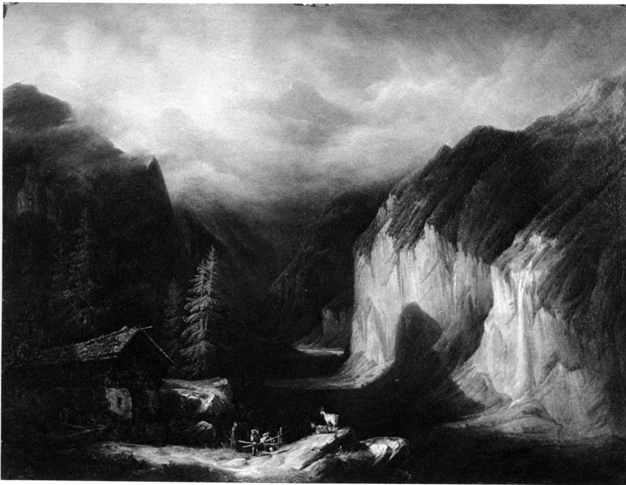
Figure 9. François Diday, La cascade de Pissevache. Temps d'orage (1852). Musée d'art et d'histoire, Genève.

Avant que Diday n'effectue ses premiers voyages dans l'Oberland, l'écrivain zurichois David Hess, vingt ans avant Rodolphe Töpffer, avait persifflé les «fiseurs de vues», et envisagé, dans une pensée très précoce, mais qui rejoignait sans le savoir celle de W.-A. Töpffer, ce que pourrait être une véritable école de paysage de montagne, et il écrivait, avec assez de finesse et d'humour: «Le véritable amateur d'art ne peut se contenter toujours de sentiments doux, il cherche aussi le sublime: il aimerait entendre le fracas des torrents et des avalanches, il voudrait voir de grandes masses d'ombres opposées aux points de lumière, des forêts courbées sous l'orage, des arbres frappés par la foudre et précipités dans l'abîme; il se lasse de se promener toujours