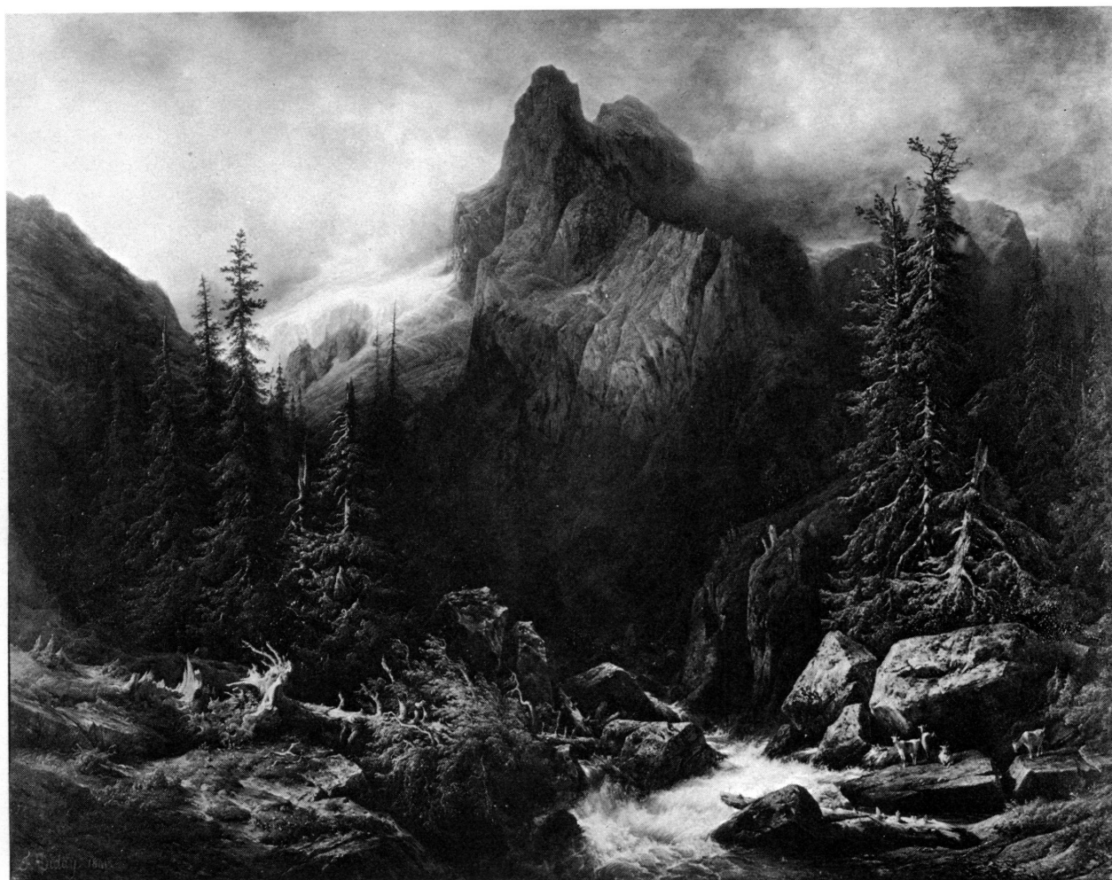
Figure 8. François Diday, Le Wellhorn et le glacier de Rosenlauri (1841). Musée cantonal des beaux-arts, Lausanne.

avec Le Mont-Blanc vu de Sallanches . 41 D'autre part, maint tableau, indépendamment d'autres caractères que nous allons analyser, se veulent d'une belle composition équilibrée et classicisante comme un hommage aux expériences italiennes de l'artiste: ainsi Frenières , 42 ou L'Eiger un des derniers, sinon le dernier tableau de l'artiste (1877). 43 Et même si le site ne permet que difficilement une composition équilibrée, Diday force le sentiment d'équilibre par un artifice de paysage, comme dans Le chemin du Grimsel, le soir (1840), 44 où des sapins adroitement placés au centre du tableau masquent le déséquilibre des masses rocheuses.