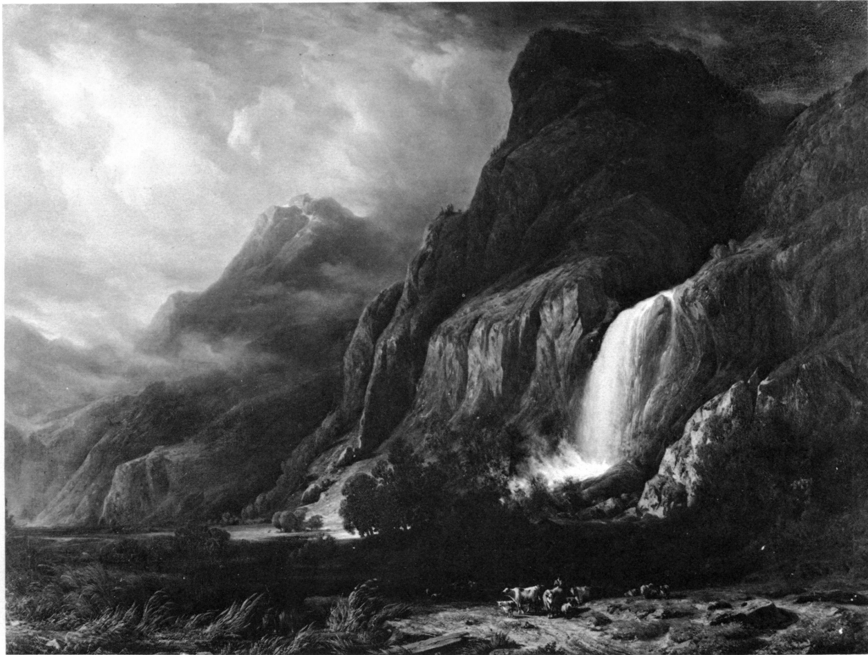
Figure 7. François Diday, La vallée de Lauterbrunnen et la cascade de Giessbach vues de Wengen (1835). Kunstmuseum, Berne.

venait d'apparaître. Quoi qu'il en soit, après ses années d'initiation à la peinture, au cours desquelles il n'a pas pu ne pas rêver sur les tableaux de Pierre-Louis de La Rive, il prend en 1824, comme ce dernier, et comme tant d'autres, le chemin de l'Italie.