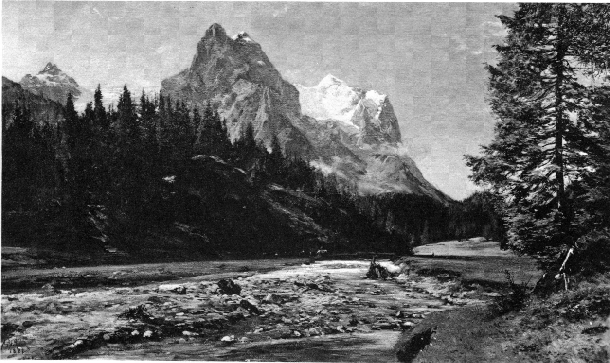
Figure 5. Aug.-Henri Berthoud, Sur le chemin de la Grande Scheidegg (1882). Musée d'art et d'histoire, Genève.