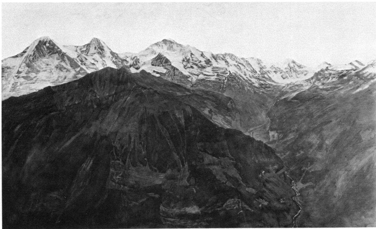
Figure 6. Gustave Jeanneret, Le premier rayon . Musée d'art et d'histoire, Genève.

FRANÇOIS DIDAY, alors âgé d'une vingtaine d'années, était peut-être des visiteurs de l'exposition de la Société des amis des arts de Genève à laquelle Maximilien de Meuron avait envoyé Le Grand Eiger . Il était un familier de Wolfgang-Adam Tœpffer, et, soit qu'il ait eu par le vieux maître des échos des écrits de Rodolphe Tœpffer, soit qu'il ait lu ceux-ci, sans doute n'a-t-il pas pu échapper au souffle du nouveau lyrisme qui