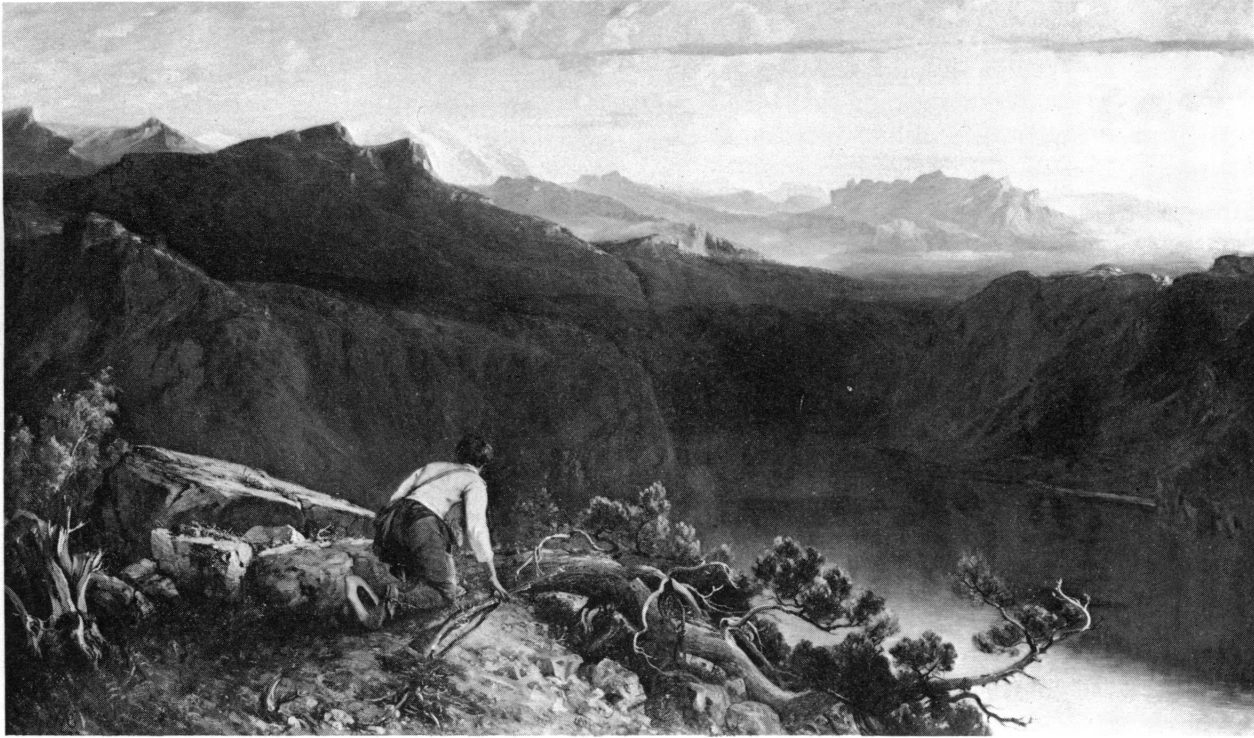
Figure 4. Albert de Meuron, Le matin dans les Alpes (1882). Musée d'art et d'histoire, Genève.