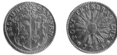
Pistole de Genève (de 35 florins) (1752-1772)