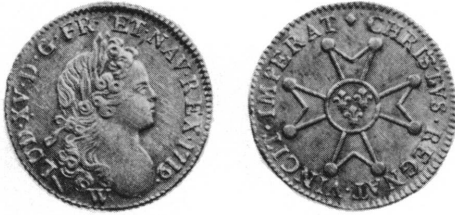
Louis XV (1718-1719) – louis à la croix de Malte