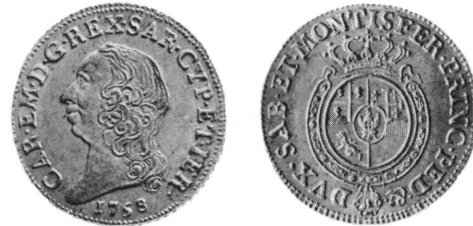
Doppia de 24 lires de Savoie (1755-1772)