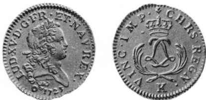
Louis XV (1723-1725) – louis mirilton