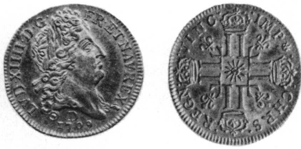
Louis XIV (1709-1711) – louis au soleil