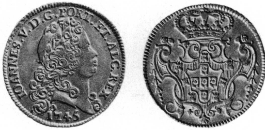
Dobra da 4 escudos du Portugal (1722-1777)