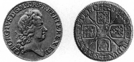
Angleterre, guinée de Georges I (1726)

12. GUINÉE XI D XII G 8,30 g D. II 6 (9)