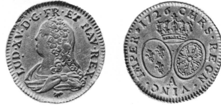
Louis XV (1726-1728) et (1740-1765) – louis neuf