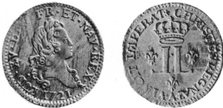
Louis XV (1720-1723) – louis aux deux L couronnées