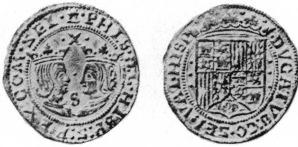
Ducat au nom de Philippe II (dès 1580), de Zélande

12. GUINÉE XI D XII G 8,30 g D. II 6 (9)