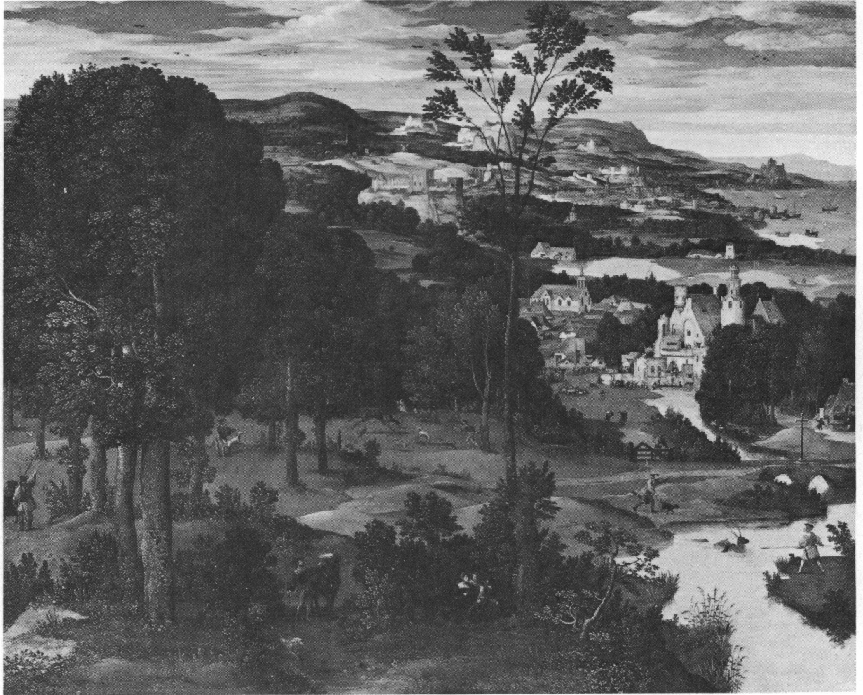
Fig. 9. Joachim PATINIR. Paysage avec scène de chasse. Vers 1520. Inv. 1975-12