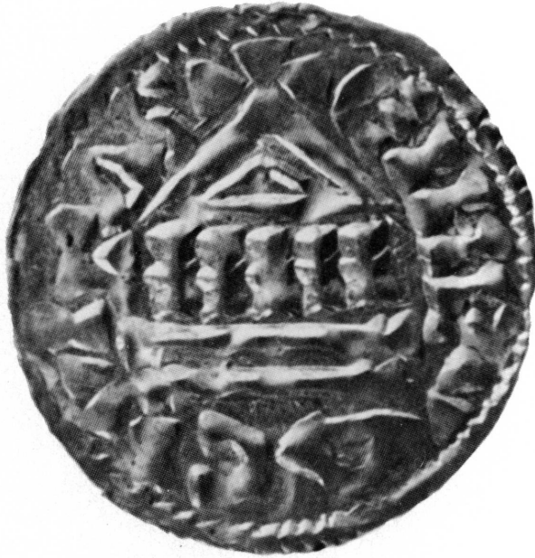
Fig. 3. Denier de l'évêque de Genève CONRAD. XI e siècle. Basilique (revers). Inv. 32577

Sou d'or avec la représentation du Christ. Byzance, Justinien II (692-695).