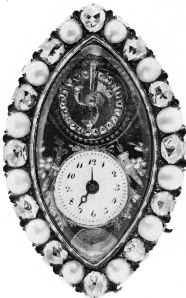
Fig. 6. Montre-bague en or et argent. Suisse, vers 1830. Inv. AD 2505

Ces œuvres ont été présentées par Claude Lapaire dans: Genava , n.s., t. XXIII, 1975, pp. 147-152.