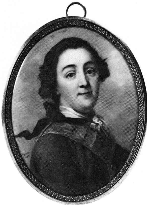
Fig. 8. Miniature de Jacques THOURON. Portrait de Catherine II de Russie. 1783. Inv. AD 2509

Epinette signée Pasquino Quercy, Florence, 1624. Don de la famille Cingria-Zanello, Genève.