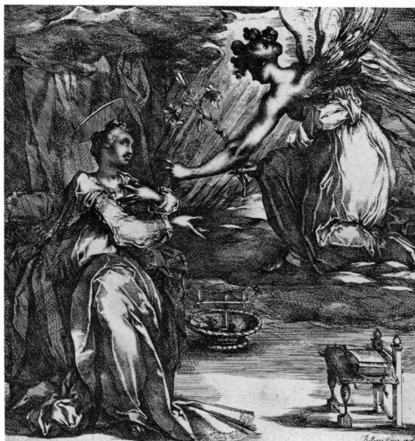
Fig. 12. Jacques BELLANGE. L'Annonciation. Vers 1610. Inv. E 75/117