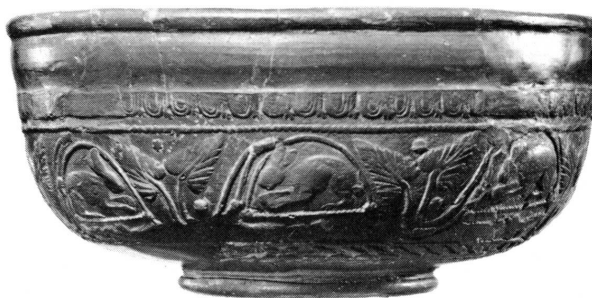
Fig. 2. Bol en terre sigillée. Atelier de Gaule méridionale. Inv. 21665