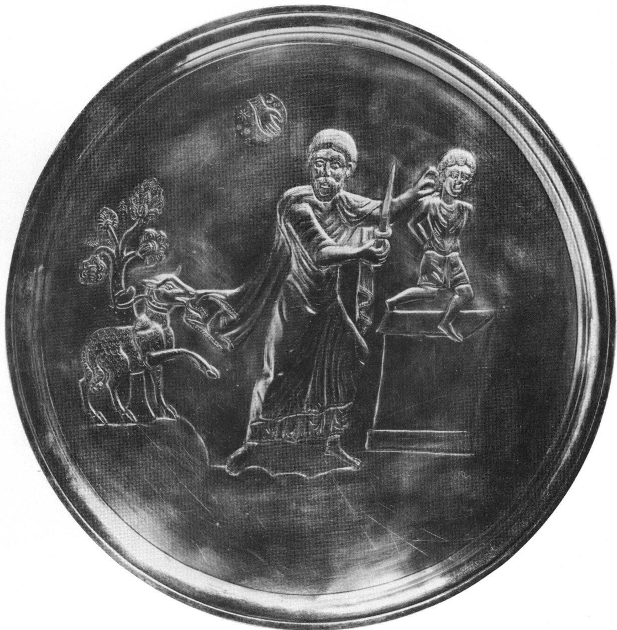
Fig. 5. Plat en argent. Byzance, VII e siècle. Le sacrifice d'Abraham. Inv. AD 2383