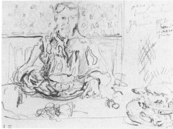
Fig. 10. Edouard VUILLARD. Le repas. Vers 1890. Inv. 1975-70

Sculpture monumentale en bronze. Inv. 1974-15. Déposée sur l'ancienne promenade de l'Obser- vatoire.