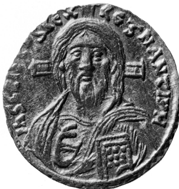
Fig. 1. Sou d'or. Byzance, JUSTINIEN II (692-695). Inv. 32578

(Cf. M.-R. SAUTER, Chronique des découvertes archéologiques dans le canton de Genève en 1970 et 1971 , dans: Genava , n.s., t. XX, 1972, pp. 119-121 et D. PAUNIER, Une inscription lapidaire dédiée à la foudre trouvée à Bernex , dans: Genava , n.s., t. XXI, 1973, pp. 292-293, fig. 7).