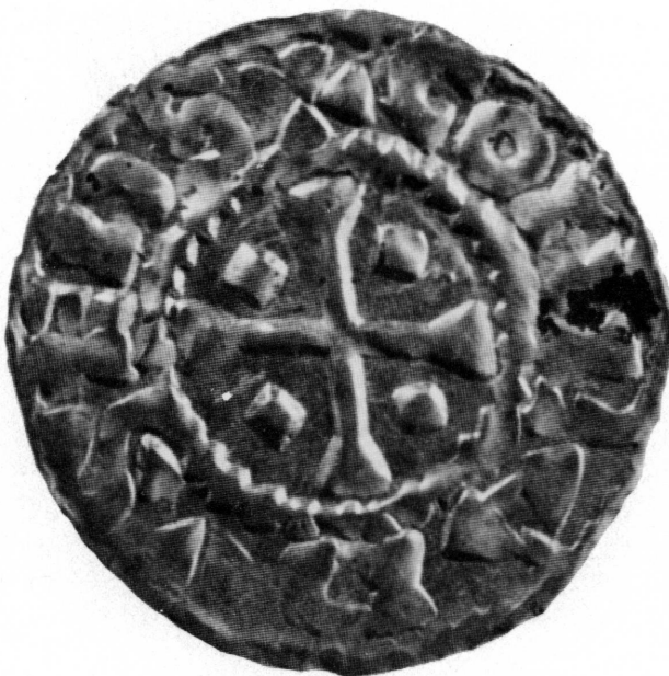
Fig. 4. Denier de l'évêque de Genève CONRAD. XI e siècle. Croix (avers). Inv. 32577