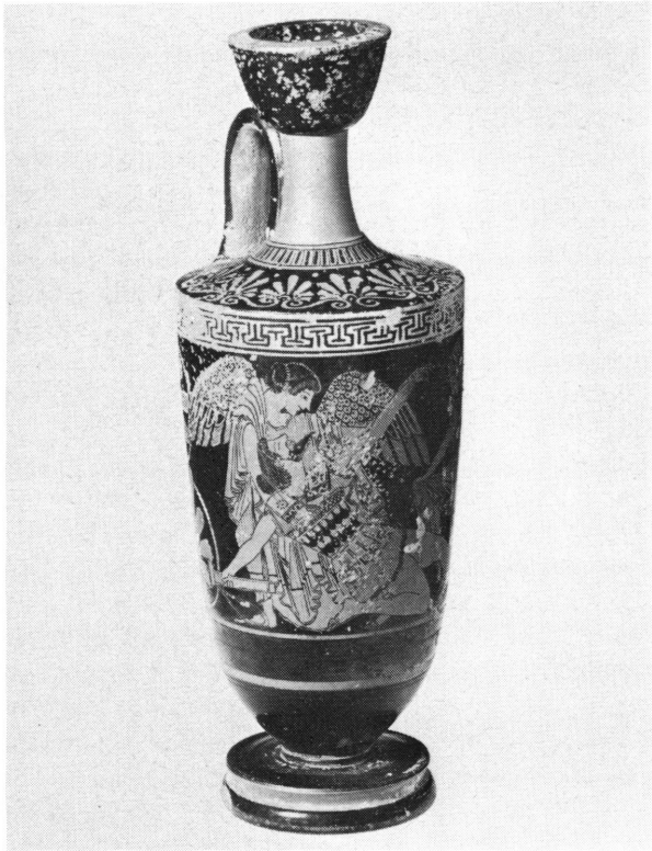
Fig. 3. Lécythe de Genève, inv. 21132: Eos et Memnon.