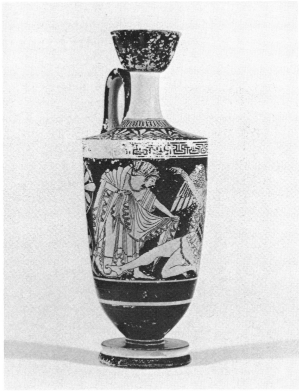
Fig. 4. Lécythe de Genève, inv. 21132: Femme au voile.

découverte récemment à Myrrhinus 29 , offre sur son chiton un antécédent prestigieux. Dans la céramique, le peintre de Kléophradès, au début de sa carrière, utilise plusieurs fois cette sorte de méandre: une kalpis à Rome 30 , un cratère en calice à Tarquinia 31 , une amphore à fond pointu à Berlin 32 . On trouve encore ce méandre sur un fragment de cratère à volutes de Sofia 33 , une péliké archaïque du Louvre 34 et un stamnos à Bâle 35 . Ce dernier vase constitue l'exemple le plus récent, vers 480 av. J.-C.