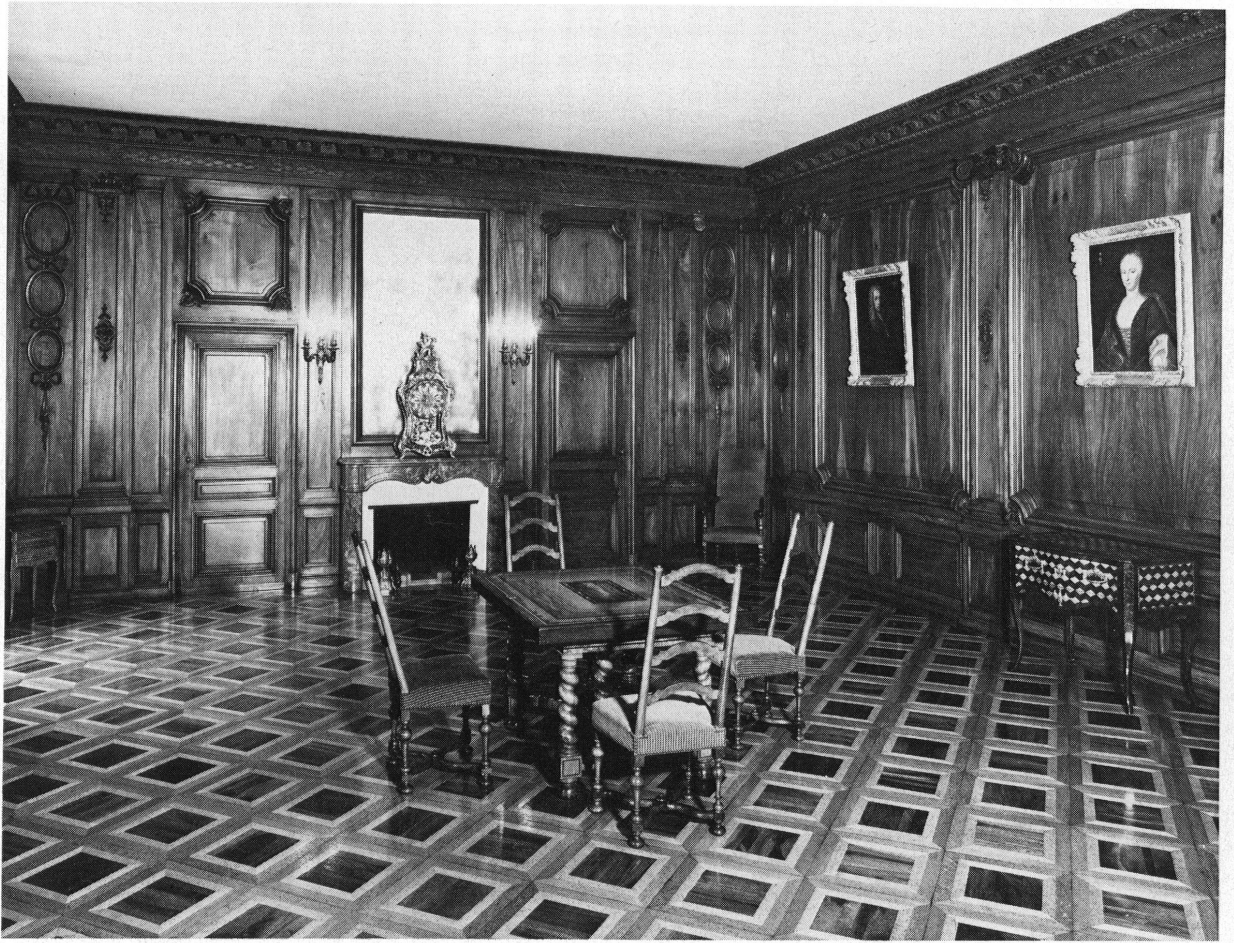
Fig. 2. Salle du Conseil d'Etat. Genève, Musée d'art et d'histoire.

Pour compléter le tableau de l'aménagement de la salle du Conseil aux XVII e et XVIII e siècles, il convient d'ajouter quelques lignes sur les meubles et le chauffage de la pièce. Elle reçoit en 1694 une « horloge à pendule » française, envoyée par le chargé d'affaires genevois à Paris 30 , car l'ancienne horloge « ne vaut absolument rien » 31 . Les frères Lagrange fournissent en août 1711 trente demi-fauteuils 32 ; en décembre de la même année, un fourneau en faïence à motif bleu sur fond blanc 33 , fabriqué par le potier de terre Daniel Künzi de Serlier, est posé 34 . Une armoire, destinée sans doute à contenir le bois de chauffage, est fournie par Jacob Galoix en 1712 35 . Le 15 septembre 1713, tous les éléments de la nouvelle décoration intérieure de la salle