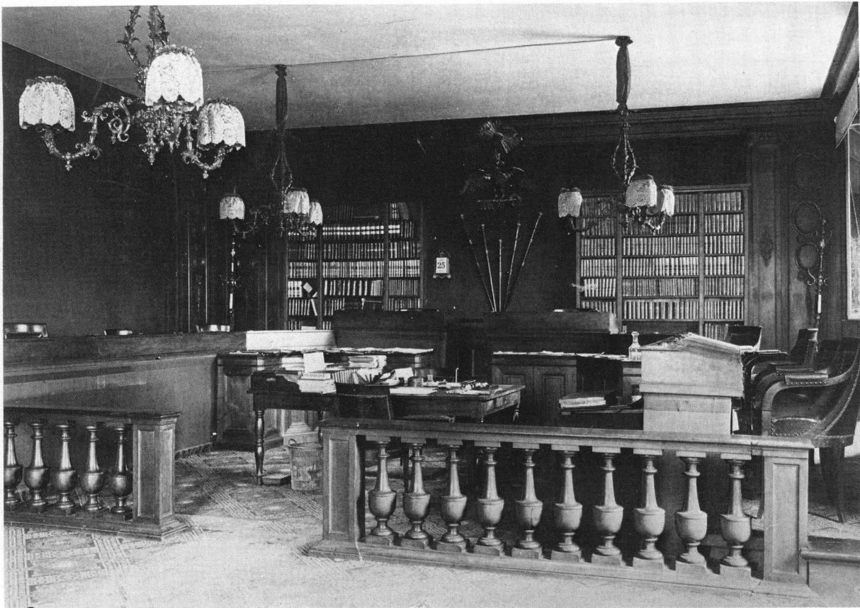
Fig. 1. Salle du Conseil d'Etat avant la restauration de 1901.

de la draperie aussi bien dans le fonds du côté de l'arsenal que dans les côtés, on le pourra boiser».