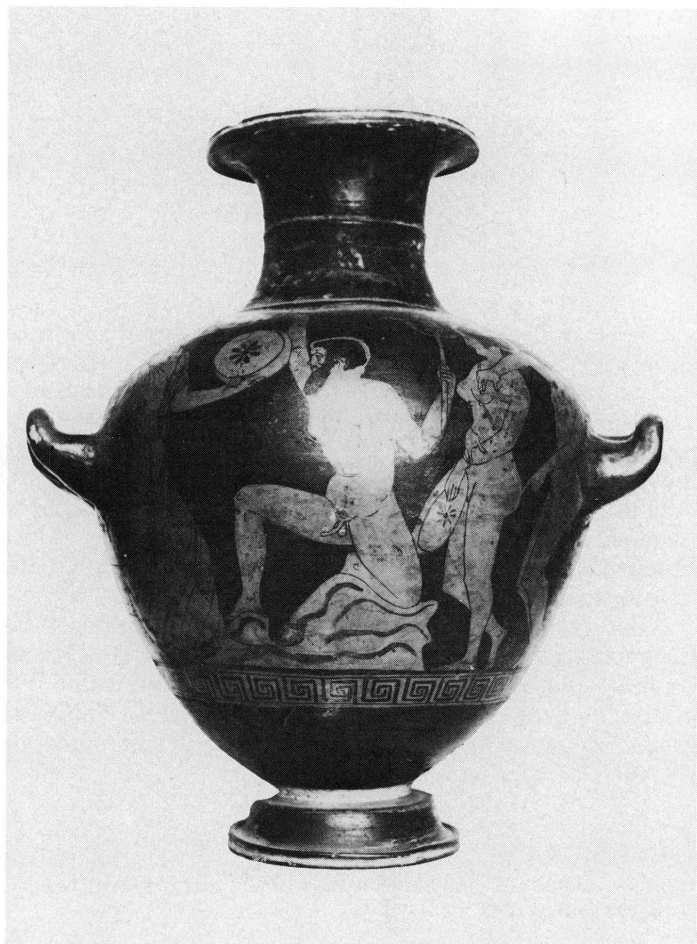
2. Hydrie du Musée d'art et d'histoire (inv. I 200). Pastiche du XIX e siècle.

Mais, revenons à la coupe de Genève. On remarquera que le guerrier porte la sorte de muselière qu'on appelait « phorbeia », instrument utilisé plus normalement par les joueurs de flûte ou aulos dans les banquets, les concours musicaux ou aussi à la guerre 9 . La bande de cuir était percée d'un trou pour le passage de l'embouchure de l'instrument. A quoi servait ce curieux accessoire, inconnu des musiciens modernes? Il devait empêcher que la lèvre de l'instrumentiste se fende sous l'effort, régulariser le souffle, masquer le gonflement des joues jugé disgracieux. Dans le cas des trompettes guerrières, ce dernier emploi n'entraîne certainement pas en ligne de compte 10 . Le décorateur de notre coupe, décidément peu attentif, a noué la lanière au-delà du couvre-nuque du casque et non contre lui, ce qui, bien entendu, ne correspondait pas à la réalité.