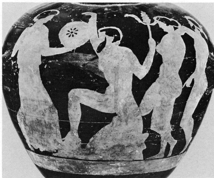
3. La même hydrie après décapage.

Le deuxième vase qui a retenu mon attention est une hydrie ou vase à trois anses (Inv. I 200) mesurant 39,5 cm (fig. 2). On le reconnaît dans un tableau de S. Straub représentant le collectionneur Walter Fol (1832-1890). L'objet est posé, bien en évidence, sur une table recouverte d'un lourd tapis et jonchée de gros in-folio. Fol ne contemple pas le vase, mais consulte un livre d'enluminures. La scène se passe à Chougny-Fontaine, dans le salon d'une grande maison du XVIII e siècle, aujourd'hui propriété d'un autre amateur éclairé 11 .