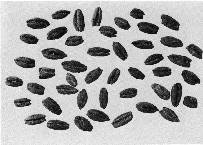
4. Grains d'orge carbonisés ( Hordeum vulgare ) provenant d'une jarre de l'édifice napatéen. Gross. 3.5 × environ.

Une autre sépulture (n° 92), très pillée, recelait également un squelette de mouton situé à l'ouest de la fosse.