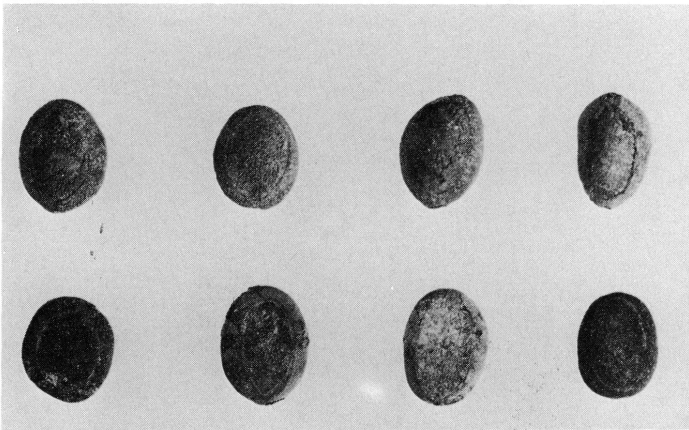
3. Graines provenant d'arbres du genre Cassia ou Albizia découvertes dans le contenu stomacal d'un agneau de la tombe 89. Gross. 4 × environ.