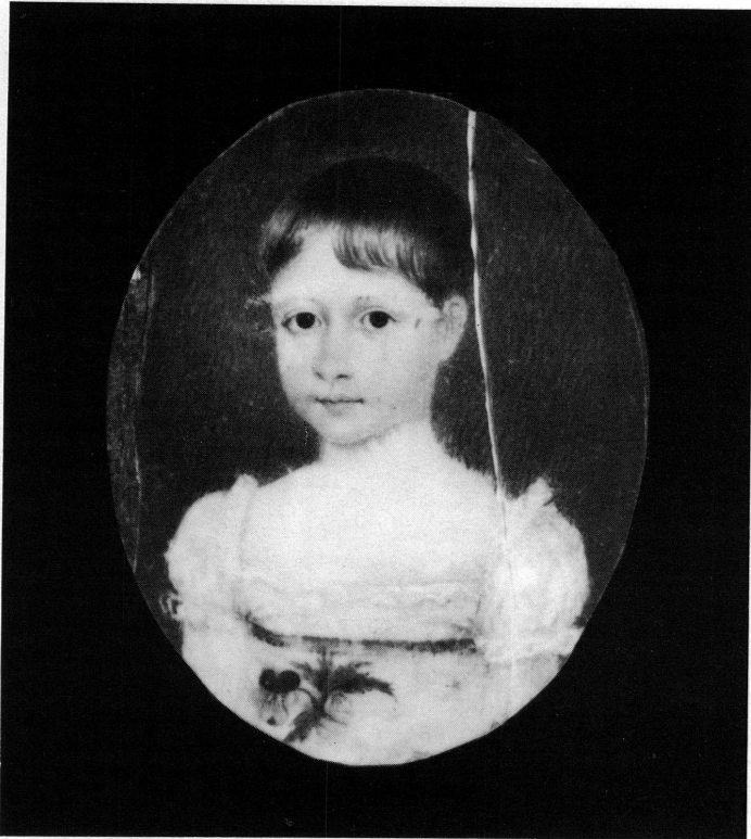
5. P.-L. Bouvier. Portrait en miniature d'une fillette de la famille Kemble. Non signé, non daté. Collection M me Eileen Argyris, Angleterre.

la réflexion de cette adorable petite fille dont le regard profond et interrogatif émeut. La chevelure, d'un beau châtain à reflets dorés est coupée très court, mais une frange irrégulière découvre en partie le front. Le regard clair et plein de précoce dignité, s'harmonise avec le teint éblouissant. Une impression de grande pureté se dégage de cette petite fille. Le fond ovale est du gris-roux que j'ai appelé la «couleur poil de lièvre» très typique des miniatures de P.-L. Bouvier. Malheureusement, l'ivoire est fendu du haut en bas, mais à côté du personnage. De plus, on aperçoit, sur la gauche, une longue écaillure du fond, là où, jadis, put se trouver la signature de l'artiste.