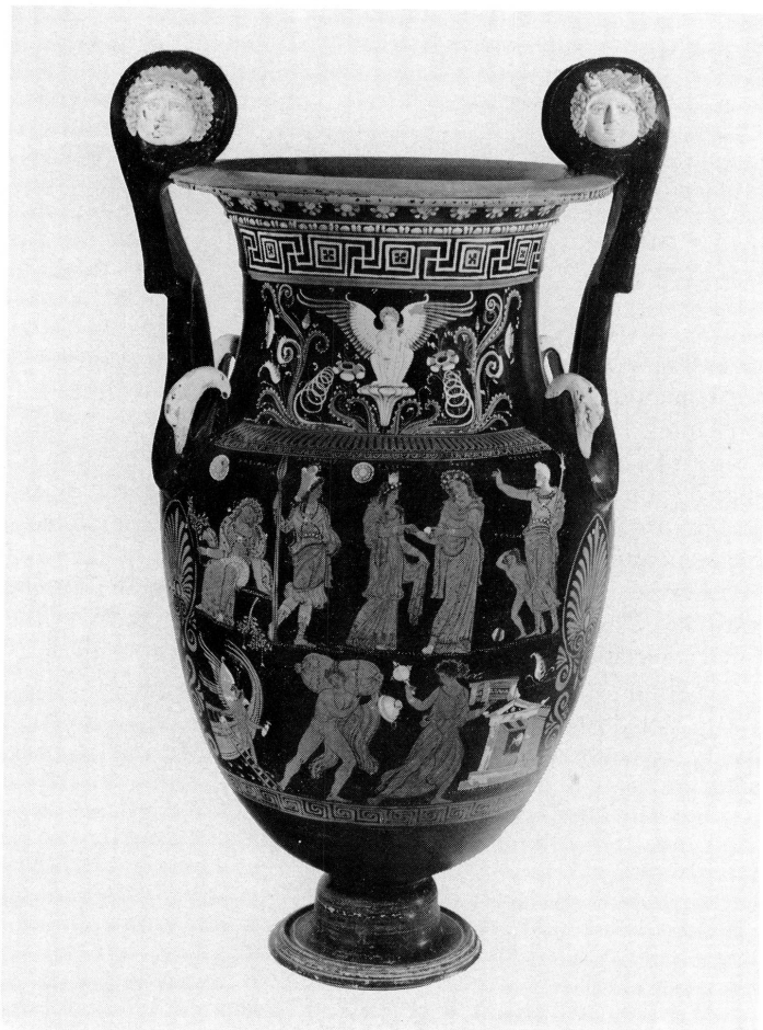
2. Amphore de Paestum. Vers 350 avant J.-C. Haut. 21 cm.