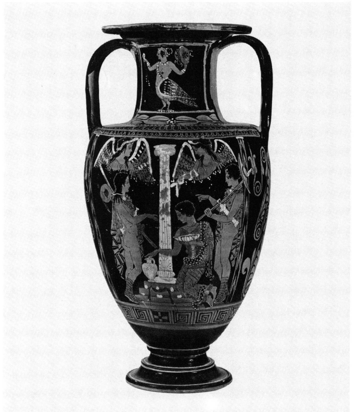
1. Cratère apulien. Vers 350 avant J.-C. haut. 74 cm.

Le musée de Genève possède une belle collection de portraits antiques. C'est dans le dessein de la compléter et de la diversifier que l'association a acquis un portrait de magistrat romain du I er siècle de notre ère, provenant de Syrie (à l'époque où Ponce Pilate était procurateur de Judée, sous le contrôle du légat en Syrie). Il s'agit d'une tête de calcaire un peu fruste, mais expressive.