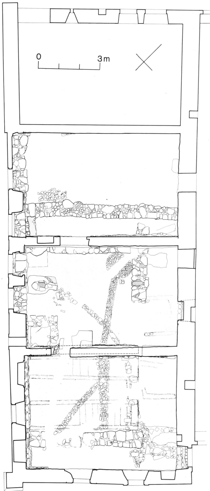
2. Meinier. Plan général des fouilles de la maison de La Tour.