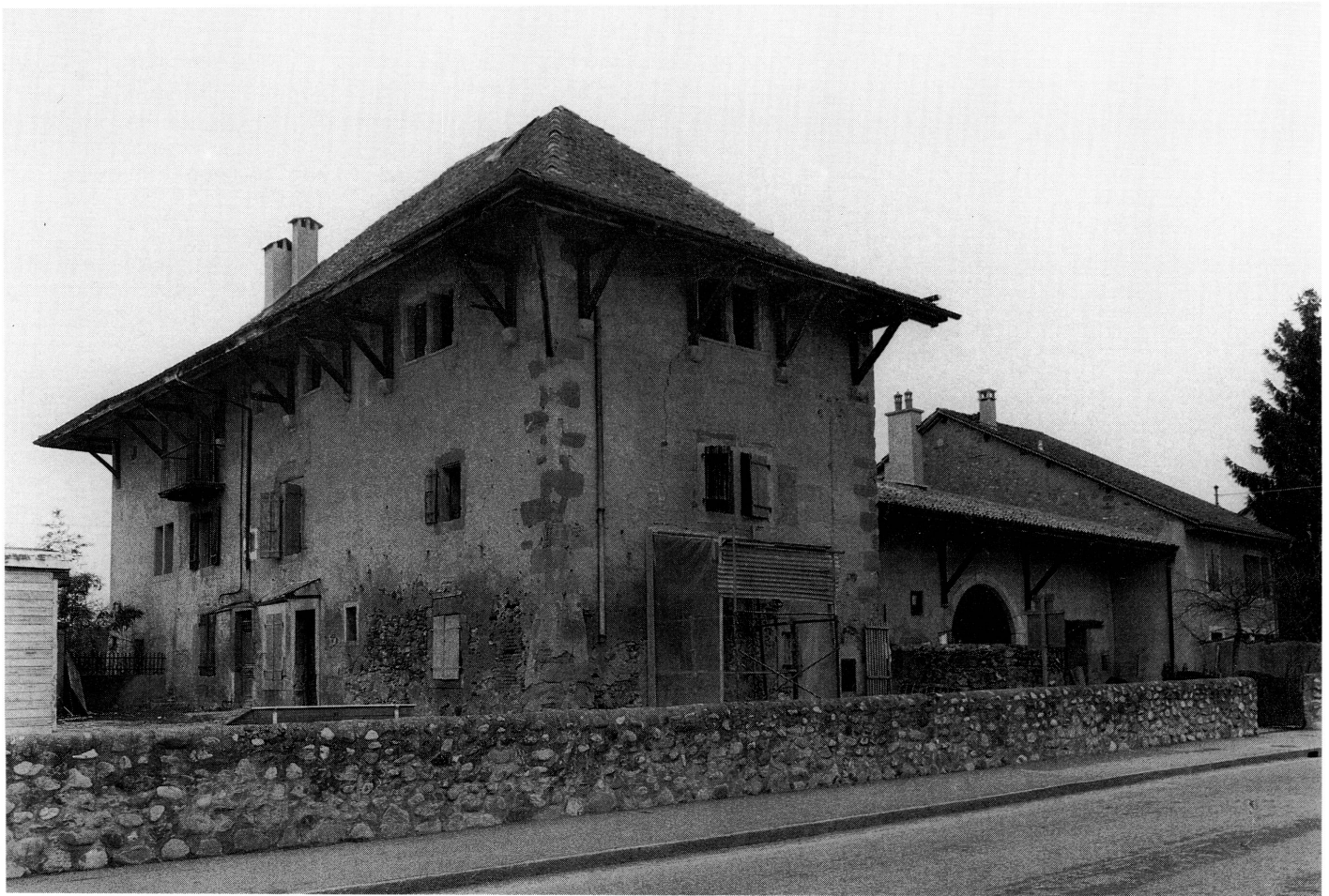
1. Meinier. La maison de La Tour.