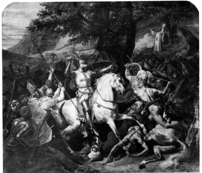
5. Horace Vernet. Bataille de Las Navas de Tolosa . Signé, 1817, Salon de 1817. 405 × 492 cm. Versailles, Musée national du château.

«Massacre de Nesle (1472). Charles-le-Téméraire, duc de Bourgogne, ayant pris d'assaut la ville de Nesle en Picardie, entre à cheval dans la cathédrale, où ses soldats outragent et assassinent les femmes, les enfants et les vieillards qui s'y étaient réfugiés. L'évêque blessé appelle la vengeance divine sur le profanateur».