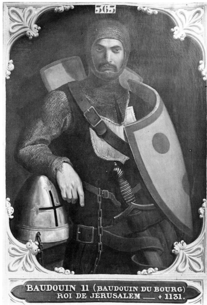
9.-10. Edouard Odier. Eustache III comte de Boulogne. Baudouin II roi de Jérusalem. Commandés en 1843. 77/81 × 104 cm. Versailles, Musée national du château.

vation, à Meudon (fig. 13) représente une Adoration des Mages d'un format étroit, probablement la pièce exposée en 1841, dont les éléments de composition remontent à Rubens et Jordaens. Plus importante, mais impossible à photographier en raison de sa position élevée, une grande toile de 1844 est conservée dans l'église parisienne de Saint-Roch, faisant partie des œuvres commandées par le préfet à différents peintres (dans ce cas à un maître qui fut probablement protestant) pour la décoration des églises 22 . On y voit à droite Saint-François et deux compagnons distribuant du pain à un groupe de quatre femmes qui se trouvent sur le côté opposé (environ 250 × 400 cm). D'autres toiles contemporaines de cette église richement décorée sont dues à Henri Scheffer et Auguste Loyer.