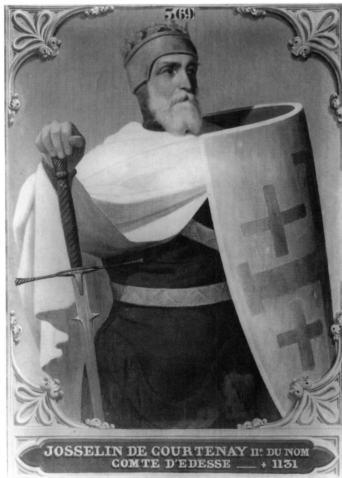
11-12. Edouard Odier. Alain Fergent, duc de Bretagne. Josselin de Courtenay, comte d'Edesse. Commandés en 1843. 77/81 × 104 cm. Versailles, Musée national du château.