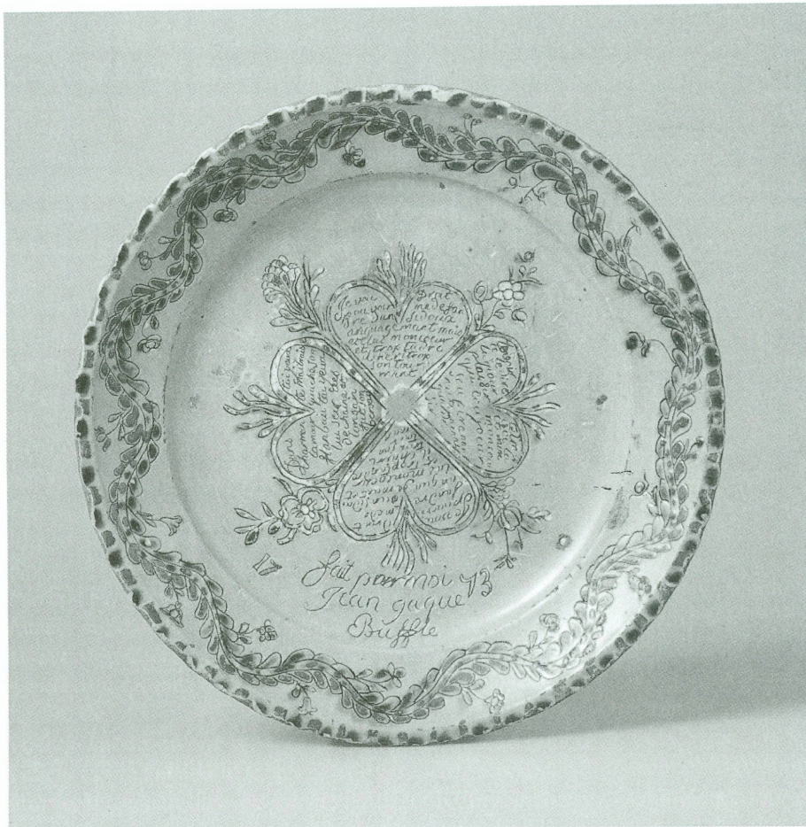
1. Plat en terre cuite. Décor peint aux engobes polychromes et gravé. Signé et daté: «1773 Fait par moi / Jean Jaque / Buffle». Diam. 38,5 cm. Genève, Musée Ariana, Inv. 17640.

«Honneur à vous, vaillants potiers de terre! Phalange de travailleurs embarbotinés De cet enduit sublime ne vous inquiétez guère Votre histoire en deux mots la voici écoutez» Louis-Vincent Dunant 1