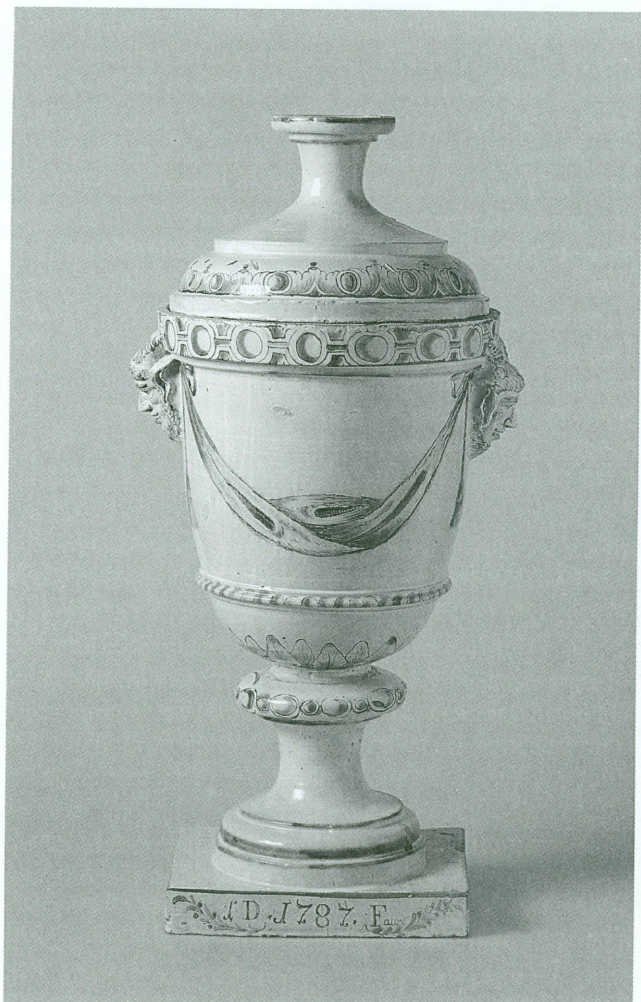
4. Vase de jardin. Faïence peinte en vert et violet-manganèse de grand feu. Signé sur la base: «I D .1787. Faure». Haut. 80, diam. 41,5 cm. Genève, Musée Ariana, Inv. AR 2753.

faïencier Honoré II Blavignac 65 . Nous rencontrons le maître potier Faure, «demeurant à Châtelaine», dans deux actes notariés par lesquels il emprunta mille cinq cents florins en 1763, puis cent écus en 1768 66 . Il possédait une poterie-terrassière dans le quartier de Châtelaine (fig. 2), où le plan Mayer de 1788 lui attribue les parcelles 13 à 20. Le lot comprenait une maison et une terrassière, une cour, deux jardins, un verger, deux places et une carpière, le tout s'étendant sur plus de cinq cents quatre-vingt-dix toises 67 . La dernière récapitulation des propriétaires, datant de 1797, signale Jean Faure au même endroit.