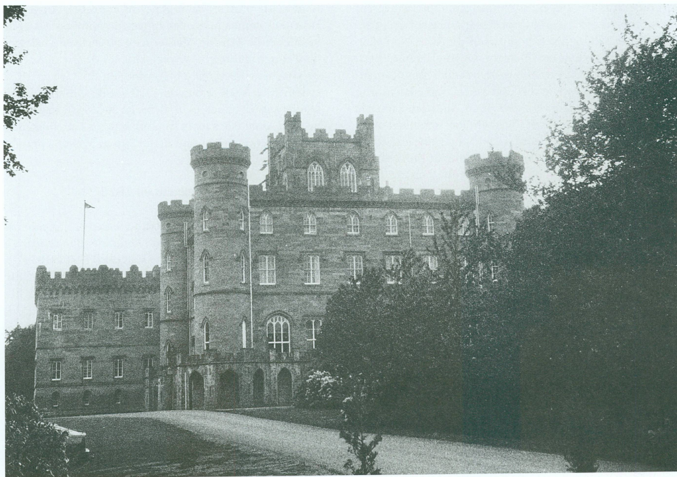
3. Vue de Taymouth Castle, Kenmore, Perthshire.

«... tu n'as pas d'idée comme ma santé s'est fortifiée; pense que malgré toutes les contrariétés et l'enuey que j'ai éprouvé; je n'ai pas eu un moment de malaise cependant j'ai travaillé plus qu'en aucun temps de ma jeunesse, je dois je crois les bonnes fonctions de mon estomac, à la tempérance que je me suis prescrite, car malgré toutes les Venaisons les foisans et les Perdrix, ainsi que tous les poissons d'eau douce et de mer, je vis comme chez moi,