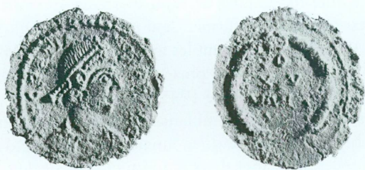
4. M 950, Gratien, 367-383, ~382, Æ 4 Av.: DN GRATIA—NVS PF AVG; buste drapé (2 rangs de perles et rosette) à droite Rv.: [V]O[T] // XV // MVL[T] // X[X] dans une couronne Æ, 1,716 g, 16,1/15,2 mm, 360°