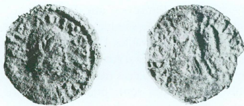
2. M 914, Arcadius, 383-408, Lyon ou Arles ou Siscia, 383-402, Æ 4 Av.: [DN] ARCADIVS PF AVG; buste drapé diadémé à droite Rv.: VICTOR—IA AV[GGG]; Victoire passant à gauche tenant couronne et rameau Æ, 0,862 g, 14,1/13,6 mm, 360°

En conclusion, sur la base du critère adopté, on retiendra que les fouilles Saint-Pierre 1995 nous ont livré du matériel numismatique qui ne dépasse pas 455 de notre ère. Il est en outre chronologiquement d'une extrême cohérence, devant être placé, dans sa presque totalité, entre 383 et les premières années du V e siècle.