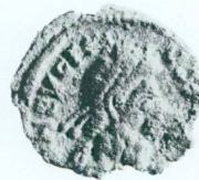
3. M 934, Eugène, 392-394, Æ 4 Av.: DN EVGENI—VS . [F AVG]; buste drapé diadémé à droite Rv.: Victoire... Æ, 0,974 g, 13,7/12,1 mm, 180°