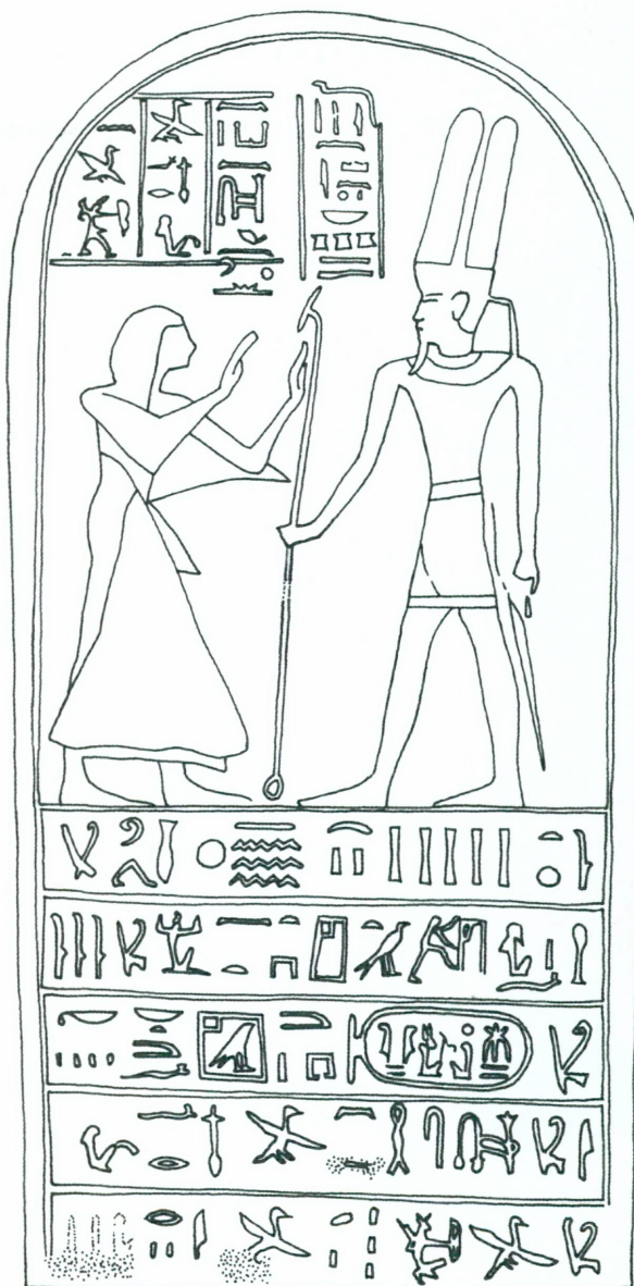
5. Fac-similé de la stèle Bolton 58.05.4 (IS 276) de l'an 5 de Ramsès IV, commémorant la construction d'un «temple de millions d'années dans le domaine d'Hathor» (Dessin N. Favry, d'après Inscriptions of Sinai , pl. LXXI)

Une autre stèle 65 , datant du même an 5 de Ramsès IV, était dressée dans la cour, devant le portique, dans une situation similaire à celles qu'avait occupées précédemment la stèle 91 de l'an 8 d'Aménemhat III 66 . Il est remarquable que cette stèle soit inscrite sur ses quatre faces à l'instar de celles