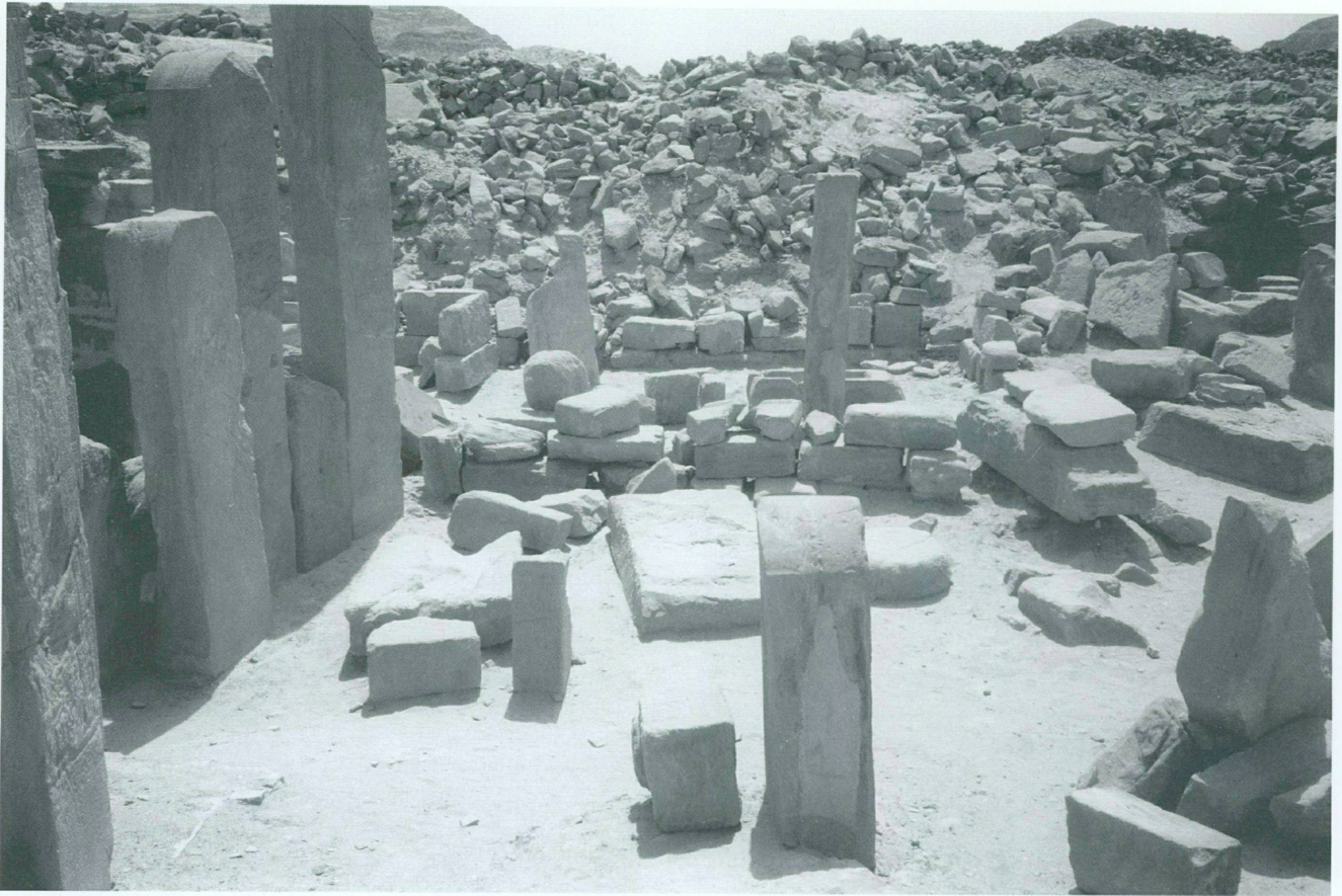
4. Vue de l'état actuel du «temple de millions d'années» de Ramsès IV en direction de l'enclos sud

renouant avec les pratiques du début de la XII e dynastie 51 , Séthi I er avait fait ériger en l'an 8, à l'extérieur de l'enceinte, à la hauteur de l'angle sud-ouest, une stèle sculptée sur les deux faces principales, qui se trouvait encore debout en 1828, comme on peut le voir sur une lithographie de Deroy 52 . Les deux scènes d'offrande concernent respectivement Horakhty et Hathor. En l'an 2 de Ramsès II, une stèle s'inspirant nettement de la face occidentale de celle de Séthi I er est dressée à gauche de l'entrée du temple 53 , tandis que, sous Sethnakht, une autre stèle similaire est élevée à droite de l'entrée 54 .