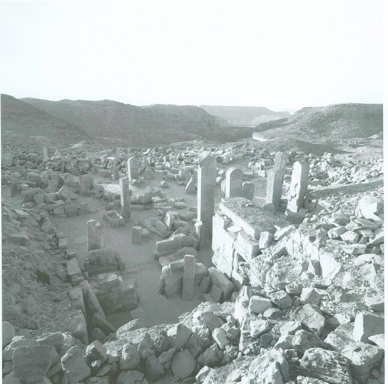
2. Vue de l'emplacement du sanctuaire thoutmoside depuis la colline orientale