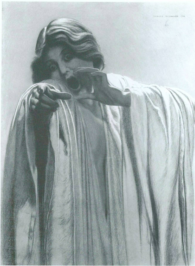
5. Carlos Schwabe, Etude pour La Vague (n° 6), 1906, fusain, crayon gras, sanguine, rehauts de pastel, 66 x 48 cm. Genève, Cabinet des dessins du Musée d'art et d'histoire, Inv. 1985-10 (voir aussi pl. VIII)

les grimaces les plus effrayantes possibles, l'expression de sentiments extrêmes et la figuration du cri, question complexe s'il en fut en peinture, sont au centre du répertoire signifiant de l'artiste.