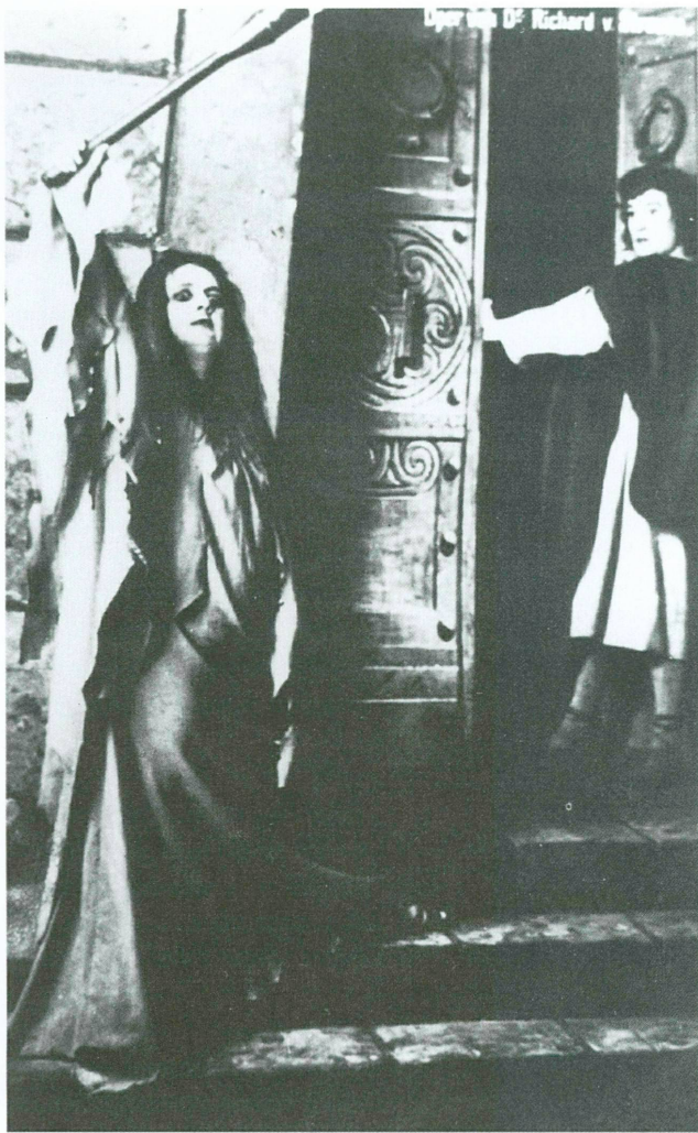
18. Anny Krull, Elektra à l'opéra royal de Dresde en 1909. Collection particulière

On retrouve ici l'image de la femme solitaire, davantage visionnaire qu'actrice, et partagée entre le délire imprécateur, le songe amoureux et l'effondrement psychologique. Les photographies de la création de l'œuvre, au théâtre royal de Dresde le 25 janvier 1909, montrent de nouveau la ressemblance saisissante de l'Elektra incarnée par Anny Krull avec les hystériques de Charcot et de Schwabe: regard exorbité, haillons, gestes outrés et cheveux en désordre 29 .