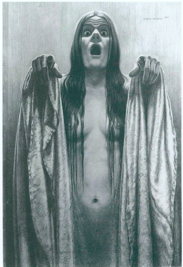
2. Carlos Schwabe, Etude pour La Vague (n° 4), 1907, fusain, crayon gras, sanguine, rehauts de pastel, 100 x 67,5 cm. Genève, Cabinet des dessins du Musée d'art et d'histoire, Inv. 1985-8

C'est pour illustrer le chapitre XXIV des Paroles d'un croyant que Schwabe imagina de figurer une vague déferlante par le surgissement de sept femmes hurlantes et paroxystiques. «Tout ce qui arrive dans le monde a son signe qui le précède, écrit en effet Lamennais, lorsque la tempête vient, on entend sur le rivage un sourd bruissement, et les flots s'agitent comme d'eux-mêmes.» L'utilisation de la mer déchaînée est en effet ici une métaphore de la révolte, du «mouvement intérieur des peuples en émoi», «signe précurseur de la tempête qui passera bientôt sur les nations tremblantes», tandis que s'annonce le «lever du soleil des intelligences».