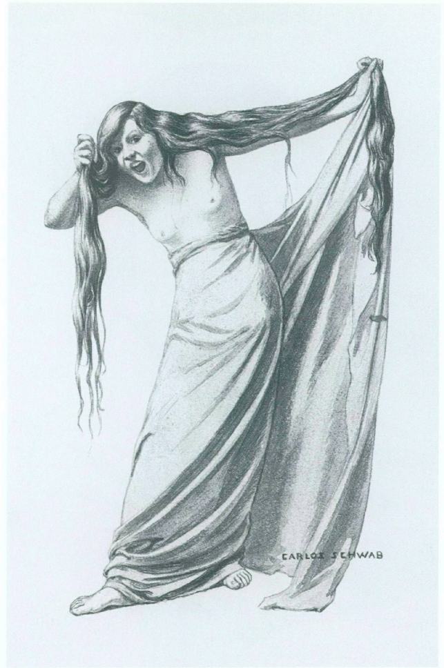
9. Carlos Schwabe, Hystérique , aquarelle, vers 1908. Collection parti- culière