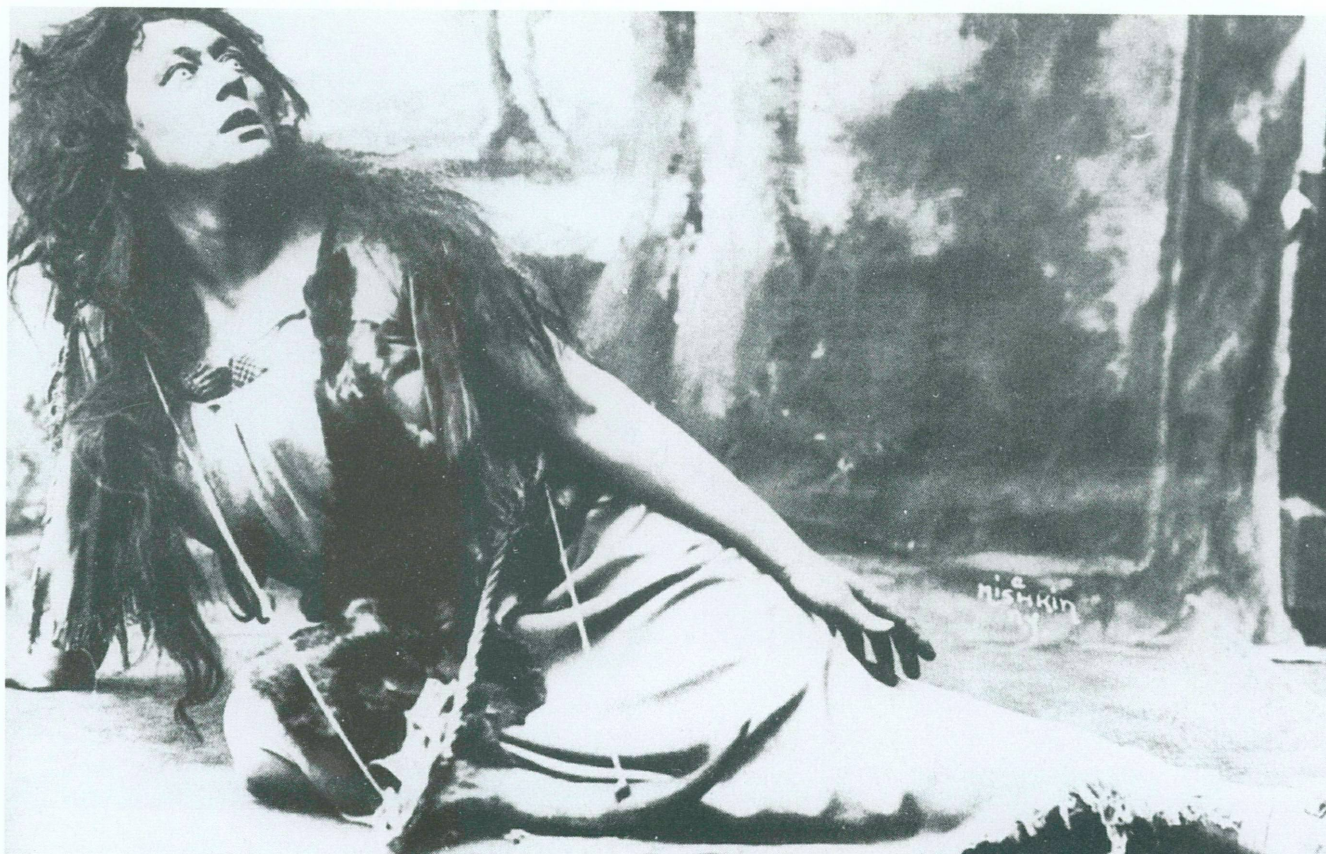
14. Olive Fremstad, Kundry au Metropolitan Opera de New York en 1909. Collection particulière

C'est bien des mêmes héroïnes tragiques qu'il s'agit et le photographe a saisi dans leurs attitudes des expressions que Charcot comme Schwabe auraient sans doute pu fixer dans leurs taxinomies physiologiques. Le reportage scénique «en direct» n'existant pas à l'époque, les interprètes de Kundry posèrent sans doute en studio mais dans des attitudes semblables à celles prises durant les représentations; la fixité photographique, cependant, ne manque pas de rapprocher leurs expressions et leurs gestes des dessins conservés à Genève. Il est frappant, en revanche, que ces prises de vues ne tentent pas de simuler le chant, aucune des cantatrices n'y étant saisie dans l'exercice vocal, tandis que c'est le cas de toutes les figures incantatoires de Schwabe, et de nombreuses patientes de Charcot. En ce qui concerne les femmes de La Vague , ces figures sont d'autant plus opératiques que leur posture et l'utilisation très théâtrale de leurs drapés s'accompagnent en effet d'une tentative de représenter le son de leurs voix.