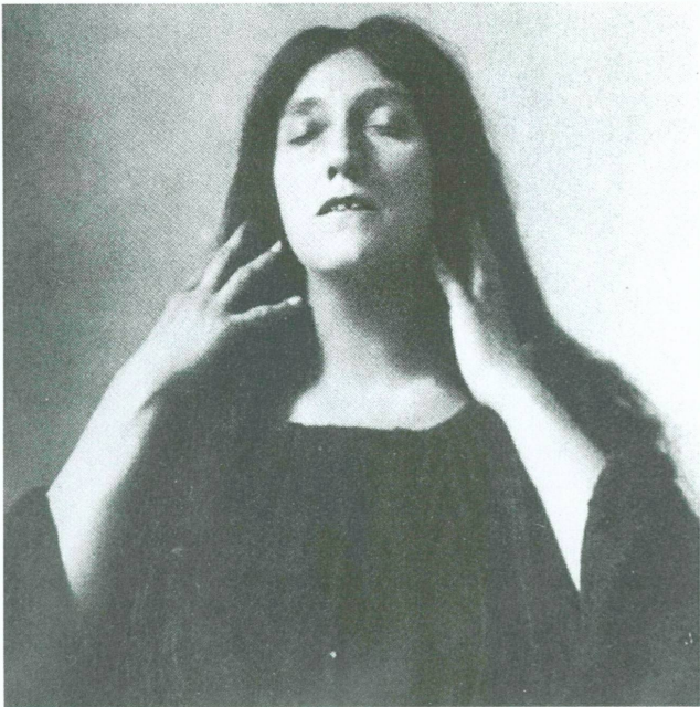
11. Anna von Mildenburg, Kundry à Bayreuth en 1897. Collection particulière