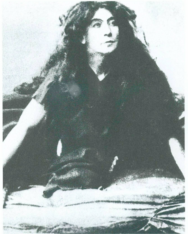
12. Marianne Brandt, Kundry à Bayreuth en 1882.