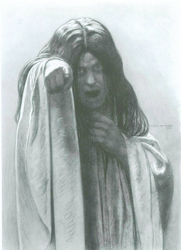
3. Carlos Schwabe, Etude pour La Vague (n° 3), 1906, fusain, crayon gras, sanguine, rehauts de pastel, 66 x 48 cm. Genève, Cabinet des dessins du Musée d'art et d'histoire, Inv. 1985-7