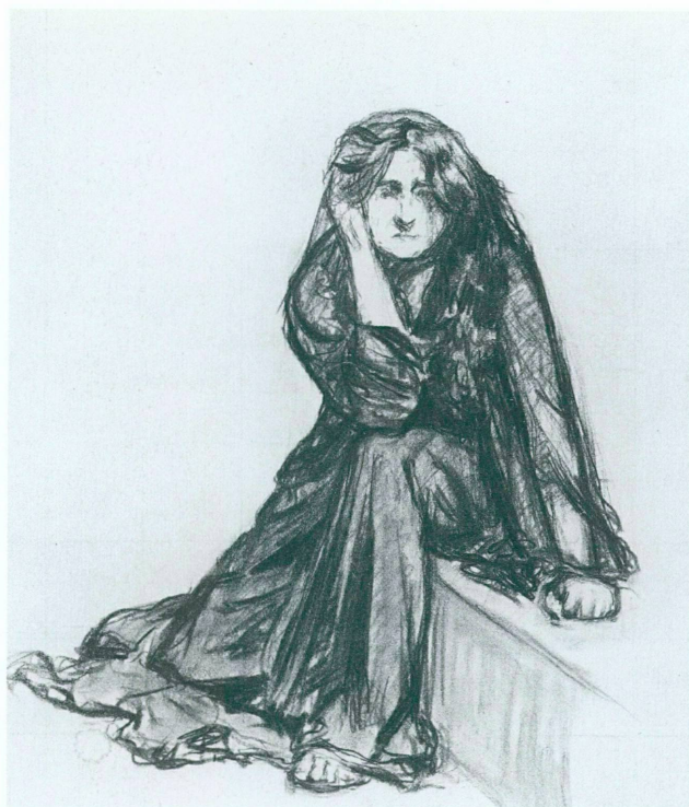
17. Amédée Gibert, Etude pour le portrait de Louise Sylvain dans le rôle d'Electre , 1906, crayon noir, 60 x 52,5 cm. Marseille, Musée des Beaux-Arts

Les différences entre le livret opératique et l'œuvre antique sont significatives. Si les grandes lignes de l'action sont respectées (monologues désespérés d' Elektra , affrontement titanique avec Clytemnestre, annonce de la mort d'Oreste, recherche de la hache, retrouvailles du frère et de la sœur, meurtre de la mauvaise mère et d'Aegisth), les modifications disent aussi quelle dimension particulière Strauss et Hofmannstahl voulaient insuffler à leur œuvre. Les ressorts psychologiques de la tragédie de Sophocle y sont exploités jusqu'à l'extrême et l'on sait quelle importance revêtait la psychanalyse pour le librettiste, lecteur des Studien über Hysterie de Josef Breuer et Sigmund Freud, publiées en 1895. La dimension tragique d' Elektra est en effet renforcée par la fascination névrotique qu'exerce sur elle Agamemnon, le père assassiné. Cette affection frustrée se reporte sur le frère aimé d'un sentiment incestueux, en vain. Elektra ne participe pas au meurtre de la mère honnie, lequel a lieu sans l'aide même de la hache qu'elle a pieusement conservée et, seule, tandis qu'Oreste, Chrysothémis et le palais entier se réjouissent de leur libération (dans la coulisse), elle s'effondre morte après une danse paroxystique où se mêlent exultation et désespoir.