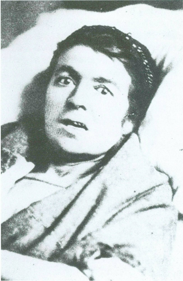
6. «Contracture de la face», dans Bourneville et Régnaud, Iconographie photographique de la Salpêtrière , tome I