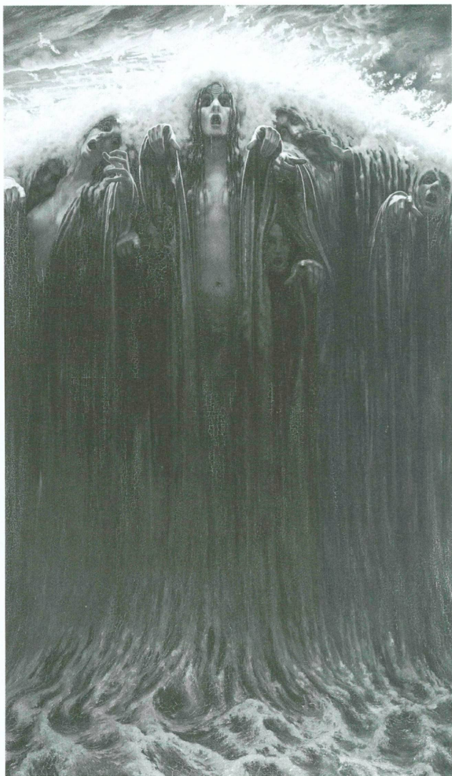
1. Carlos Schwabe, La Vague , huile sur toile, 196 x 116 cm. Genève, Musée d'art et d'histoire, Inv. CR 161

Quelques années avant la Première guerre mondiale, le peintre et illustrateur suisse Carlos Schwabe (1866-1926) fut confronté à une période de graves difficultés 1 . Allemand d'origine, naturalisé genevois et demeurant à Paris depuis 1884, l'artiste avait connu une gloire précoce en donnant au mouvement symboliste quelques œuvres majeures (1895: La Mort du fossoyeur , 1898: La Vierge aux lys ) et plusieurs séries d'illustrations qui furent saluées comme étant emblématiques du renouveau du spiritualisme à la fin du XIX e siècle ( Le Rêve de Zola, L'Effort de Haraucourt, Les Fleurs du mal de Baudelaire, etc.). Proche des cénacles idéalistes les plus militants, il avait contribué à leurs tentatives conquérantes en concevant l'affiche du premier Salon de la Rose+Croix du Sâr Péladan en 1892 et en participant à l'aventure éditoriale de revues à la créativité aussi riche qu'éphémère (couverture et frontispice de L'Idée libre et de L'Art et l'idée ). Sa technique très singulière du dessin, influencée par les Préraphaélites et par Dürer, avait séduit les milieux symbolistes, les bibliophiles les plus exigeants et les mécènes mystiques, dont la très mélomane comtesse de Béarn, par un subtil mélange de primitivisme et de complexité que mettait à profit une richesse d'invention particulièrement visionnaire.