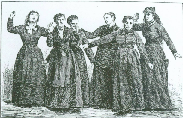
7. «Catalepsie provoquée par un bruit intense et inattendu», publié par P. Régnaud dans Les Maladies épidémiques de l'esprit en 1887

l'imprécation gestuelle des patientes mais aussi par le récit dramatique de chacune d'entre elles, ainsi que le relate Charcot à propos de leurs hallucinations et autres attitudes passionnelles: «le malade entre lui-même en scène et par la mimique expressive et animée à laquelle il se livre, les phrases entrecoupées qui lui échappent, il est facile de suivre toutes les péripéties du drame auquel il croit assister: [...] guerres, incendies, révolutions» 10 .