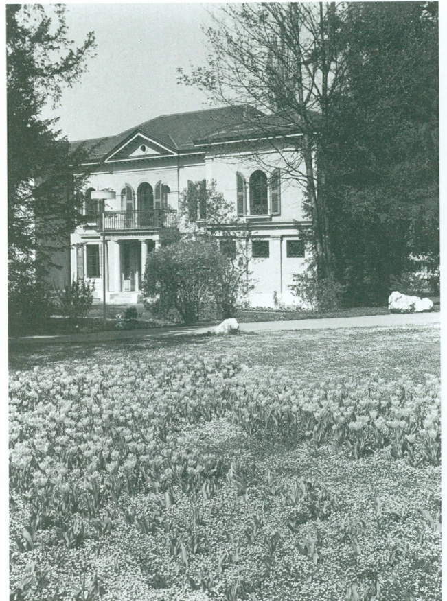
1. La Villa Bryn Bella construite en 1842 probablement par l'architecte Jean-Philippe Monod, affectée aux collections d'horlogerie, d'émaux et bijoux du Musée d'art et d'histoire en 1972

Mettre en scène des petits objets (une moyenne de cinq centimètres) est un exercice difficile. La pratique aidant, on finit par trouver à la fois un style et un ton qui ne démentent ni le message de ces témoins d'une histoire bien genevoise, ni le discours qui s'impose inévitablement au conservateur. La sobriété et la simplicité sont des atouts définitifs, incontournables, pour que soient valorisées la beauté sereine des décors souvent prépondérants, et la puissance des mécanismes. Il s'agit à la fois d'un choix esthétique et intellectuel. Comment rendre accessible, limpide, éclairant, un domaine compliqué : technique de fabrication ou de fonctionnement, si ce n'est par une tranquillité de présentation et une clarté explicative. Trop montrer ou trop dire revient à rompre avec la pertinence. L'impertinence,