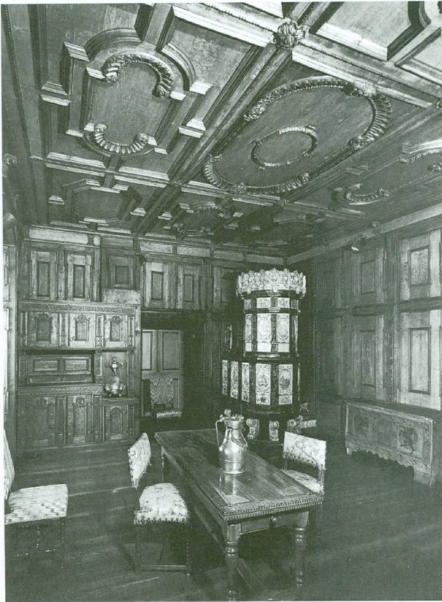
2. La grande chambre du château de Zizers, 2 e moitié du 17 e siècle

d'amateurs, représenté par J. Mayor, s'est engagé à nous laisser choisir pour 20 000 d'objets et à se charger ensuite du reste pour 10 000 Frs [...]. Nous avons réuni des souscriptions s'élevant à un total de 19 500 Frs.» L'achat fut conclu en décembre 1899. Après une campagne de relevés et de photographies, les lambris et plafonds de la vingtaine de chambres furent divisés en trois lots. Un lot, laissé sur place, fut revendu pour 2 000 Frs en 1901 aux propriétaires du château. Un second lot fut démonté et mis en vente, mais les acheteurs tardèrent à se manifester. Enfin, le troisième, comprenant les lambris, plafonds, planchers, fenêtres et poêles de cinq chambres, avec la porte principale du château, fut expédié à Genève. Le démontage et le transport entraînèrent des frais considérables auxquels virent s'ajouter les soucis de l'entreposage. La Société fit don de ce matériel à la Ville 7 qui prit à sa charge l'entreposage et le remontage.