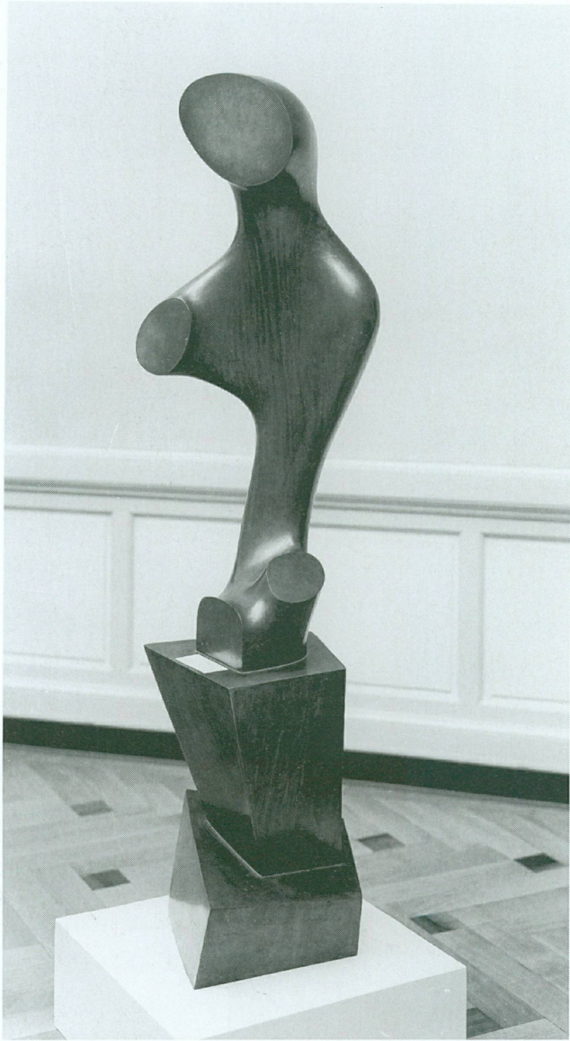
4. Jean Arp (1886-1966), Daphné II, 1960. Bronze, haut. 155 cm Acquis avec l'aide de la Société, Inv. 1964-157

«Il y a bien des gens à Genève qui voudraient que le Musée ne fût rempli que de spécimens d'art suisse, que dis-je, d'art genevois [...]. Je ne crois pas que ce soit le rôle de notre Musée d'abord parce que Genève a toujours largement participé à la vie intellectuelle et artistique de l'Europe [...] ensuite parce que ceux de nos concitoyens qui ne peuvent pas aller dans les capitales étrangères verront en passant dans notre Musée s'ouvrir devant eux de nouveaux horizons» affirmait le président en 1932. Quelques acquisitions de peinture française moderne témoignent de ce désir d'ouverture avec des toiles de Signac (1921), Marquet (1925) et Le Sidaner (1926). Une subvention permit l'achat par le Musée de La Seine en aval de Vétheuil de Monet (1932). En 1937, le Marquet fut échangé contre Le Paquebot à Venise , de meilleure qualité et entouré de deux autres paysages de cet artiste. Ces quelques toiles furent complétées par un petit Intérieur de Vuillard (1943).