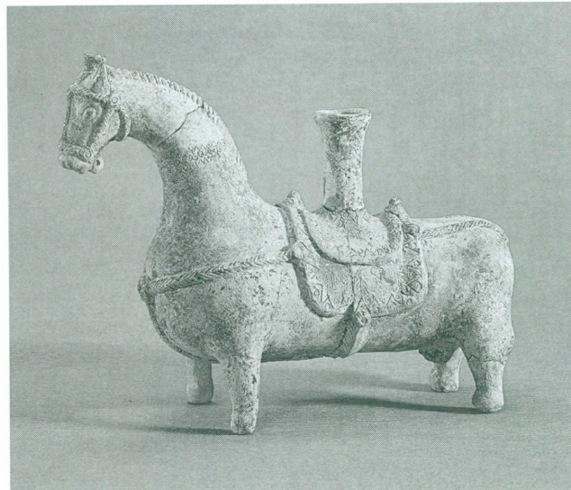
1. Rhyton en forme de cheval harnaché, Ardébil (Iran), 4 e s. av. J.-C. Terre cuite, 22 × 29,3 cm, Inv. 20327

En 1893, l'organisation de l'exposition d'art ancien, dans le cadre de la future exposition nationale qui devait avoir lieu à Genève en 1896, fut confiée à Camille Favre. Cet ancien élève de l'École des Chartes s'entoura des conseils des plus