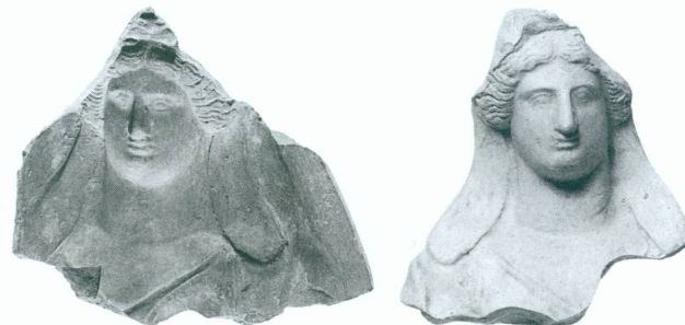
1 a, b, c. Artémis à la léontè | Moule 2 MAH, inv. 12497 a = face extérieure, b = creux c = réplique moderne (échelle \pm 1:3 )