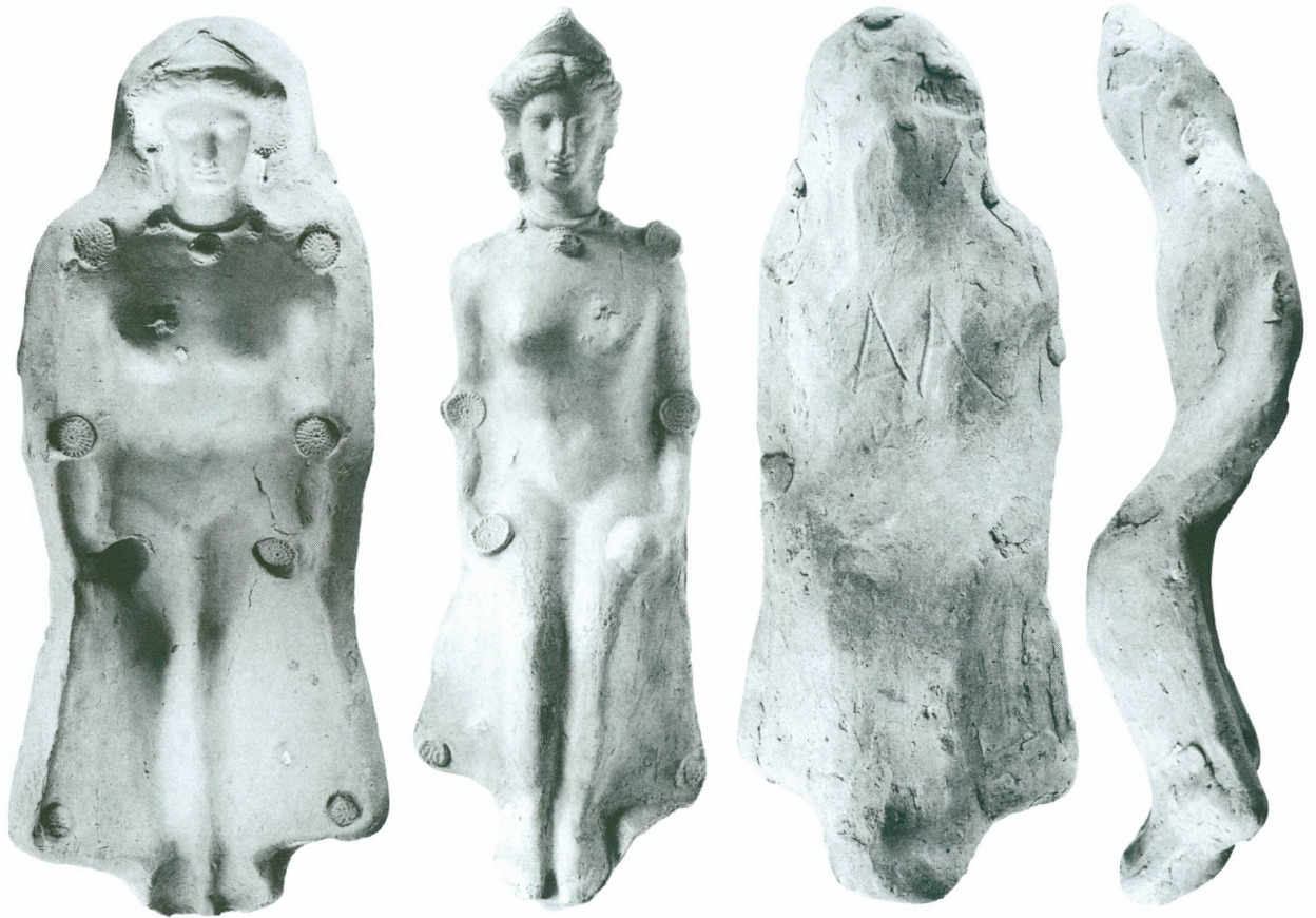
Moules avec « pastilles » et/ou incisions

51. Sur ce type iconographique, voir désormais GRAEPLER 1997, pp. 214-216