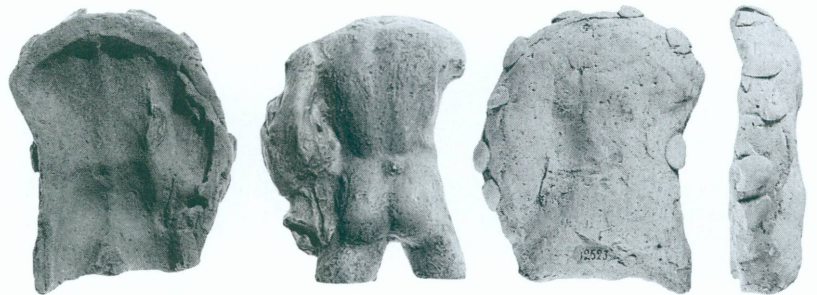
7 a, b, c, d. Torse athlétique | Moule 4 MAH, inv. 12522 a = creux, b = réplique moderne c = face extérieure, d = côté gauche de la face extérieure (échelle \pm 1:3 )