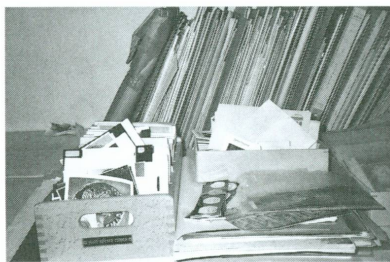
1. Voir au sujet de cette acquisition CHAPPAZ/JORDAN/COURTOIS 1999, p. 152