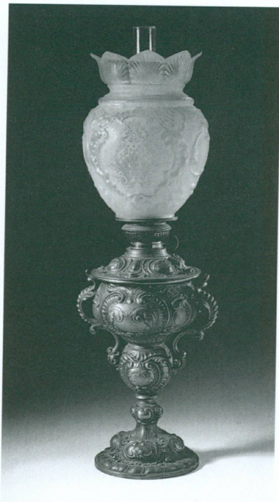
2. Lampe à pétrole, Genève, fin du XIX e siècle | Métal et verre ouvragés, tube gravé J. Bertrand & C ie (MAH, inv. 1999-302)