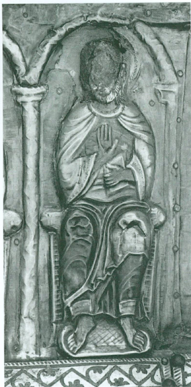
4. Châsse des Enfants de saint Sigismond - Face B , fin XII e - début XIII e siècle | Bois, argent partiellement doré, émaux sur cuivre doré, 70,5 × 33,5 × 43,2 cm (Trésor de l'abbaye de Saint-Maurice) | Détail de la plaque PB I (21 × 17,5 cm) : l'évangéliste saint Matthieu en place avec lacune au niveau de la tête (avant restauration)