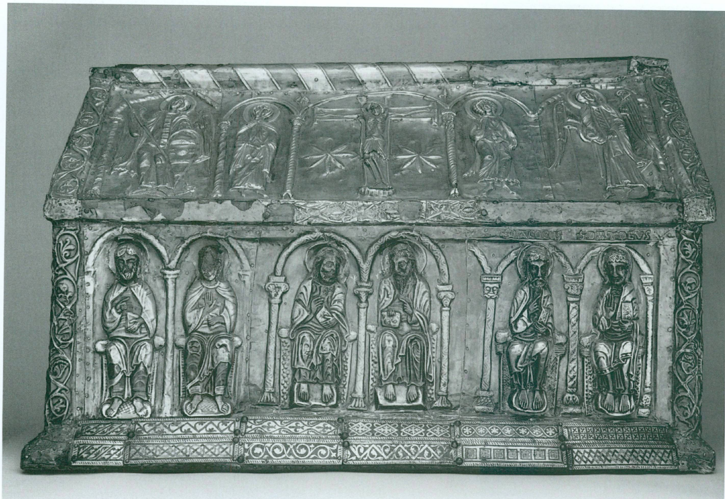
3. Châsse des Enfants de saint Sigismond - Face B , fin XII e – début XIII e siècle | Bois, argent partiellement doré, émaux sur cuivre doré, 70,5 × 33,5 × 43,2 cm (Trésor de l'abbaye de Saint-Maurice) | Vue avant restauration

(intervention directe d'interlocuteurs du Musée) et « médiation-support » (accompagnement indirect du visiteur par le biais de supports imprimés ou multimédias). Destiné aussi bien aux jeunes – en cadre scolaire ou non – qu'aux adultes, il s'est déployé de deux manières : offre d'un programme culturel trisannuel « clé en mains » et développement d'actions coéducatives menées en partenariat avec différents acteurs sociaux. En plus des désormais traditionnelles visites-conférence ou visites-découvertes, et des Moments des enfants, ateliers, cours et formations, spectacles et concerts, P'tits carnets, Graines de curieux, boîte à outils du site Internet , deux nouvelles formes d'intervention ont été définies : les Moments pour tous et les Coins-coussins .