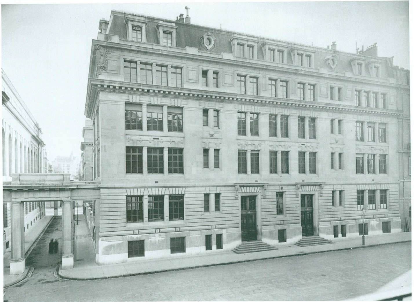
2. L'école des Casemates, peu après son inauguration, vers 1905 | Tirage à l'albumine, monté sur carton, 17,2 × 22,5/24 × 30 cm (CIG, inv. VG P 597)