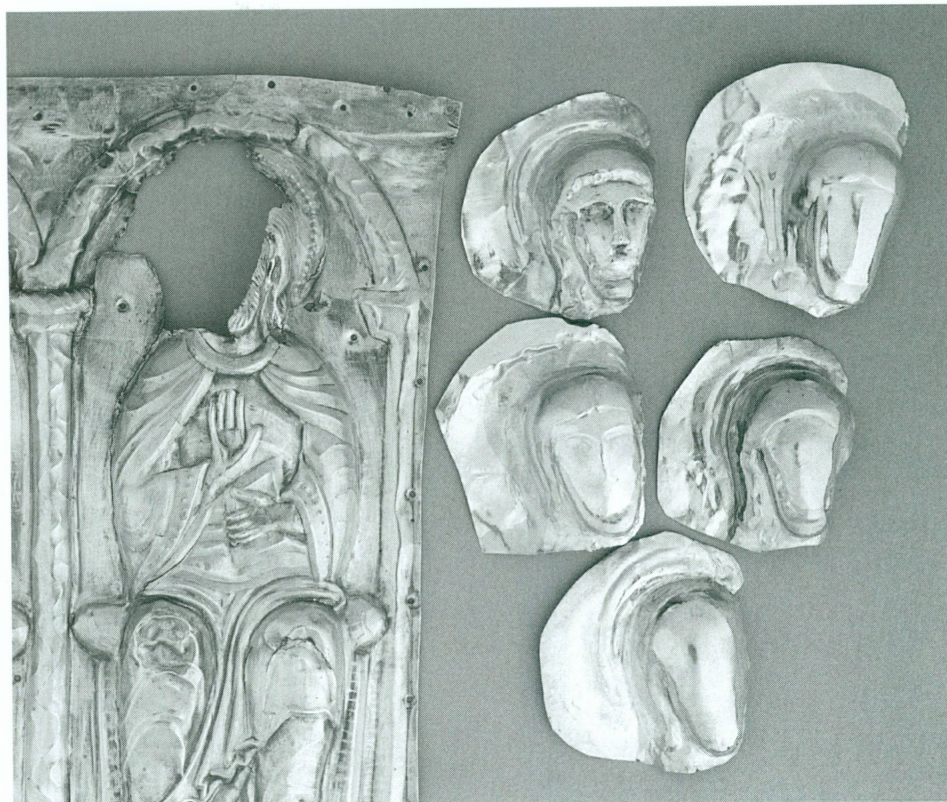
5. Châsse des Enfants de saint Sigismond - Face B , fin XII e - début XIII e siècle | Bois, argent partiellement doré, émaux sur cuivre doré, 70,5 × 33,5 × 43,2 cm (Trésor de l'abbaye de Saint-Maurice) | Détail de la plaque PB I (21 × 17,5 cm) : l'évangéliste saint Matthieu, après dépose et nettoyage, et propositions de comblement de la lacune à l'aide de différentes têtes modernes

Plus de quarante-six mille personnes ont pris part à près de mille cinq cents rencontres avec les publics abordant quatre-vingt-deux sujets différents 1 .