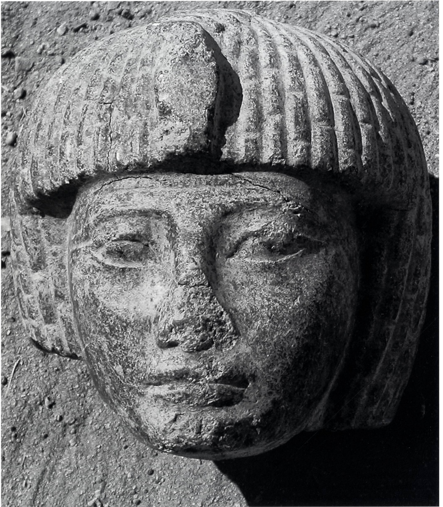
9. Tête royale en granit noir présente dans la cachette, attribuable à Thoutmosis IV