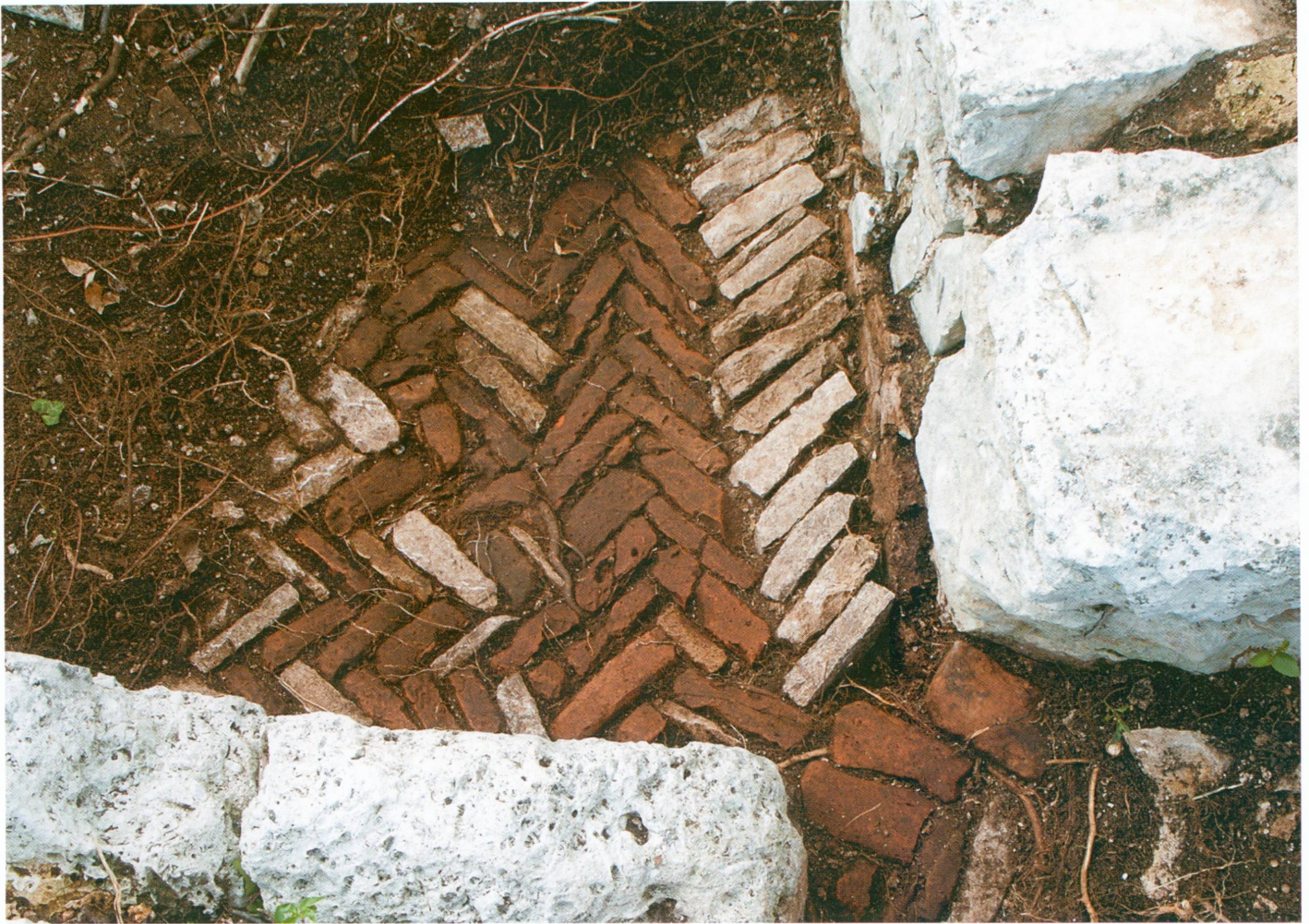
9. Guran, sondage effectué dans le collatéral nord de la basilique afin de dégager une portion du sol en opus spicatum particulièrement bien conservé

Cette première campagne de fouilles a démontré la richesse et le potentiel offert par le site de la basilique de Guran. Il est cependant nécessaire d'élargir cette recherche en l'insérant dans un contexte régional. C'est dans cet esprit que notre programme prévoit d'aborder l'étude de l'ensemble du territoire associé à l'ancien village de Guran, notamment les ruines de cette agglomération ainsi que les vestiges de l'église Saint-Simon dont la fonction serait funéraire. Pour finir, c'est l'ensemble d'une communauté humaine que l'on désire approcher afin de mieux comprendre le rôle joué par cet arrière-pays dont la fortune fut intimement liée à celle du front de mer et de ses grandes cités portuaires.