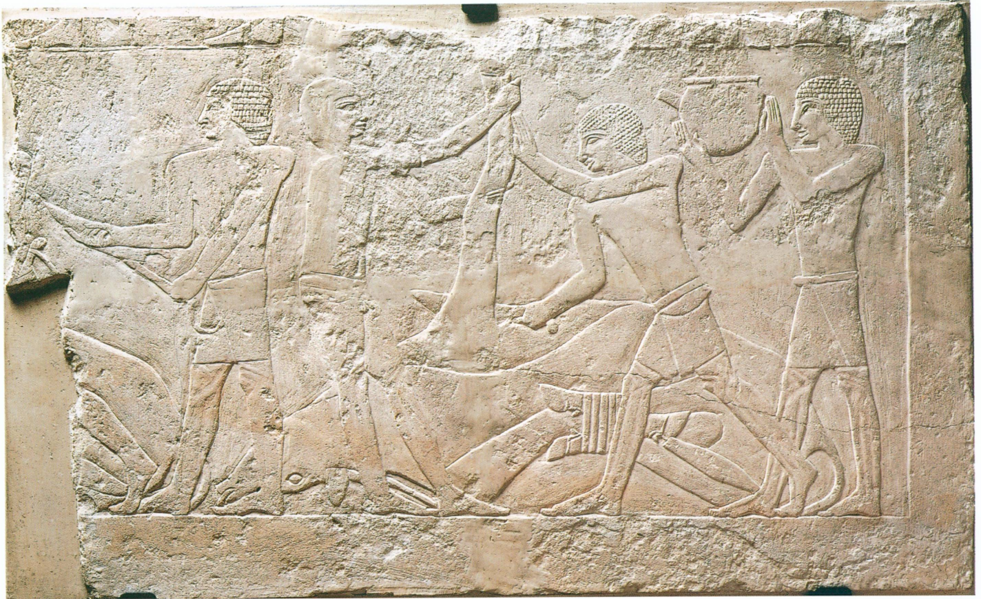
1. Saqqarah, mastaba de Ny-ânkh-nisout | Fragments de bas-relief (scène de boucherie) , Ancien Empire, fin de la V e ou début de la VI e dynastie | Calcaire, 44,5 × 74,5 cm (MAH, inv. A 2002-5)