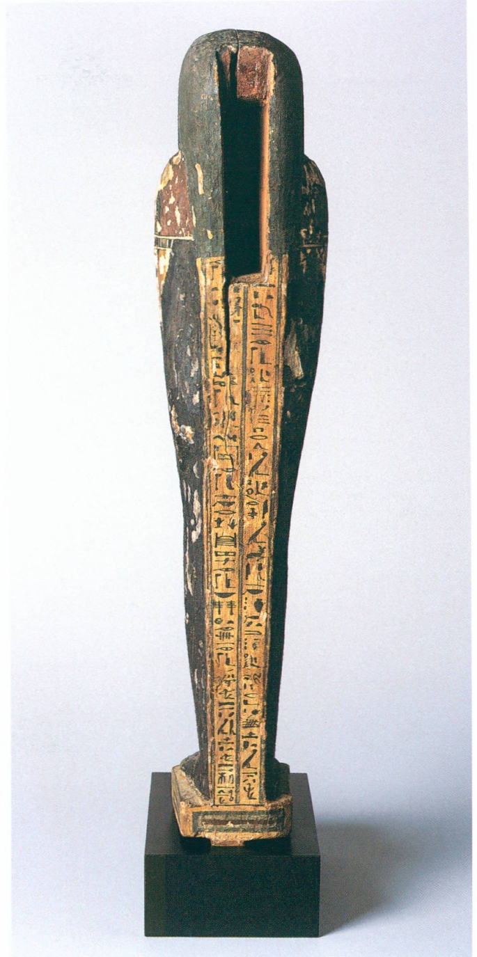
4 a-b. Provenance inconnue | Statuette de Ptah-Sokar-Osiris , fin de la Basse Époque ou début de la période ptolémaïque | Bois peint et doré, 60 cm (MAH, inv. A 2002-38)