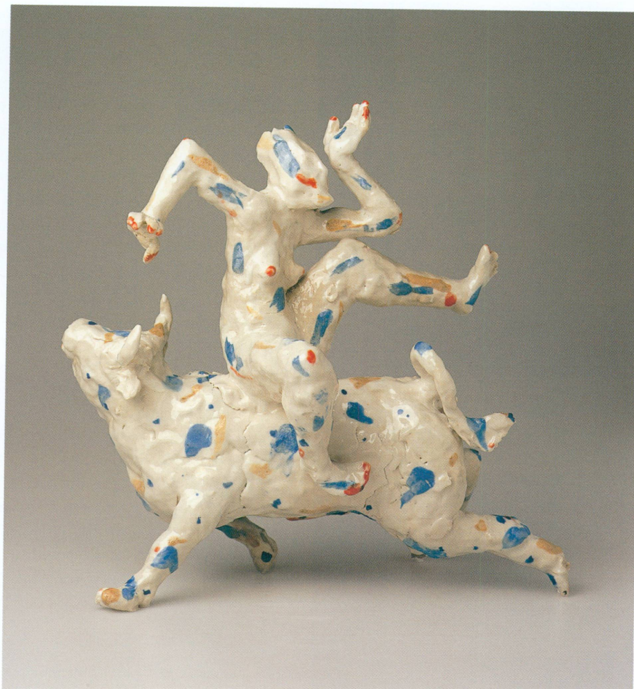
Vallendar (Allemagne), 2003 (AR 2003-189 [fig. 10]). Toujours par l'intermédiaire de l'AIC, notre fonds contemporain s'est enrichi d'une boîte en grès de Kyra Spieker (1957), Höhr-Grenzhausen (Allemagne), 1998 (AR 2003-551).