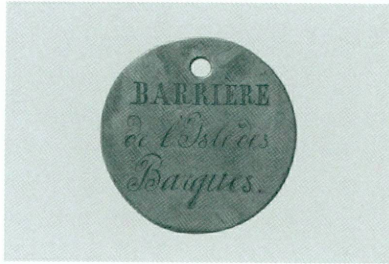
4 (à gauche). Auteur anonyme | Jeton « BARRIÈRE de l'Isle des Barques », vers 1820 | Laiton, Ø 27 mm (CdN, inv. CdN 1632)