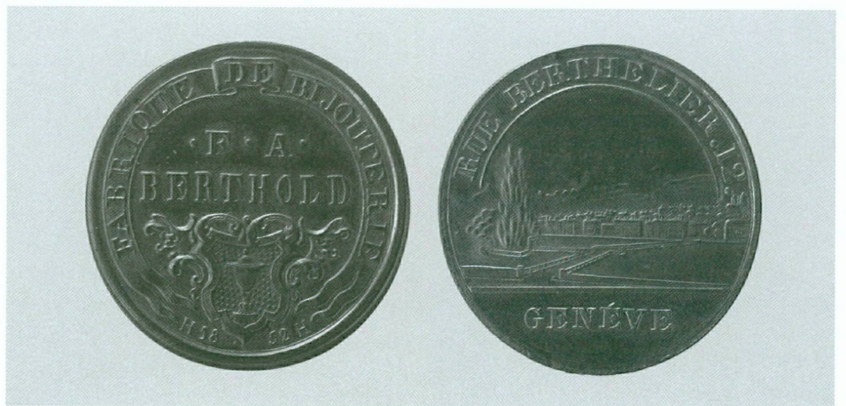
7 (en haut). Auteur anonyme | Médaille commémorative « Travail national | Souvenir des travaux des tranchées faits par les ouvriers de la Fabrique en 1848 », 1848 | Fonte de laiton, Ø 39,02/38,21 mm (CdN, inv. CdN 1999-993 [éch. 2/1])