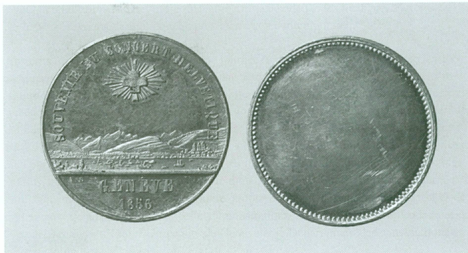
Souvenir du concert helvétique, 1856

11. Antoine Bovy (1795-1877) | Jeton commémoratif « Souvenir du concert helvétique, Genève 1856 » , 1856 | Aluminium, Ø 25 mm (CdN, inv. CdN 30989 [éch. 2/1])