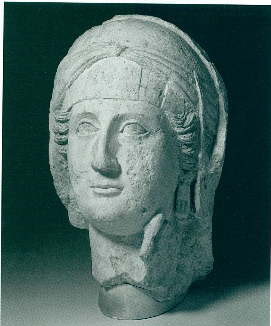
6. Portrait funéraire | Buste féminin, Zeugma, deuxième quart du II e siècle | Calcaire, 30,5 cm (MAH, inv. 2006-2)

26. On notera que la sculpture du MAH a conservé une bonne partie de sa polychromie sur la partie de la chevelure qui dépasse du voile de chaque côté de la tête ainsi que sur la pupille percée des yeux. La couleur a été obtenue par un pigment minéral actuellement roux clair.