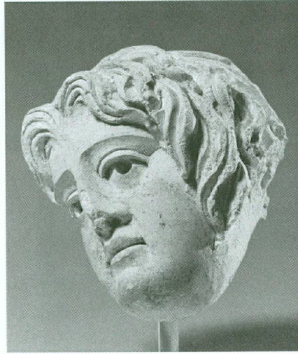
5. Tête , Palmyre, première moitié du III e siècle | Stuc (Leyde, Rijksmuseum van Oudheden, inv. S 576 B 1977)