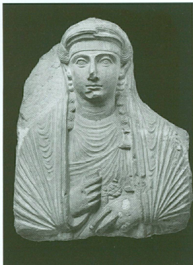
7 (à gauche). Portrait funéraire | Buste féminin, Palmyre, première moitié du II e siècle | Calcaire, 55 cm × 44 cm (MAH, inv. 13270)