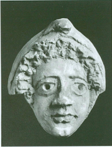
3 (à gauche). Tête , Palmyre | Stuc (Copenhague, Ny Carlsberg Glyptothek, inv. IN 3714)