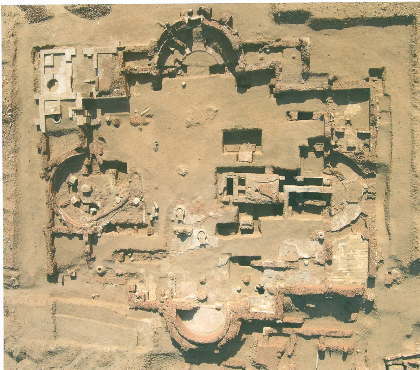
7. Farama | Église tétraconque: vue générale après la campagne de fouilles 2007

sif. Il est probable qu'un second autel était placé au-dessus de la voûte de la crypte, à un niveau plus élevé d'environ quatre mètres que le sol de l'église. Signalons encore, au nord du chœur, la présence d'une citerne circulaire de deux mètres de diamètre et de cinq mètres de profondeur si l'on tient compte du puits d'accès placé au centre de la voûte en dôme. L'accès à la citerne se faisait par ce puits de deux mètres de hauteur en utilisant des logements ménagés pour les pieds de chaque côté.