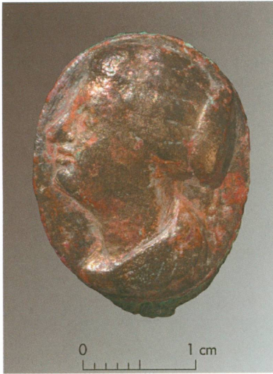
11. Farama | Fouille à l'ouest du théâtre : bague en bronze avec chaton orné d'un portrait féminin

a retrouvé quelques lambeaux du sol d'occupation de la seconde période, en particulier près du four où des briques cuites de pavement étaient associées à des amphores encore en place, dans lesquelles on mettait peut-être l'eau destinée au pétrissage et au réglage de l'hygrométrie du four pour la cuisson du pain. Qu'il s'agisse, comme pour les quatre autres fours, d'un équipement de boulangerie est en effet suggéré par les fragments de plats de cuisson circulaires retrouvés dans les fours, au-dessus d'une couche cendreuse pouvant compter jusqu'à quinze centimètres d'épaisseur.