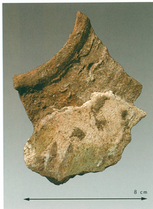
6 a et b. Farama | Fragments de peintures murales de l'oratoire

tral est alors reconstruit au-dessus des murs de la cave (fig. 5). On accédait à l'entrée en suivant un passage latéral empruntant la porte dégagée en 2006 à la limite occidentale du bâtiment et du « château d'eau ». Après s'être retourné, il fallait encore gravir quatre marches pour se trouver devant la porte du local principal. L'ouverture, de deux mètres de large, était à double battant, comme le prouvent les crapaudines creusées dans les blocs de calcaire restés en place. À l'intérieur, une série de logements ménagés le long des parois restitue le niveau du plancher qui supportait peut-être un tapis de mosaïques. Des tesselles étaient éparpillées dans le comblement, dont un certain nombre étaient encore prises dans des fragments de mortier blanc, ainsi qu'une quantité de petits éléments de peintures murales de grande qualité. Les quelques remontages possibles laissent reconnaître des vasques et de l'eau vive, éventuellement des fontaines, et peut-être un grenadier et ses fruits (fig. 6 a et 6 b).